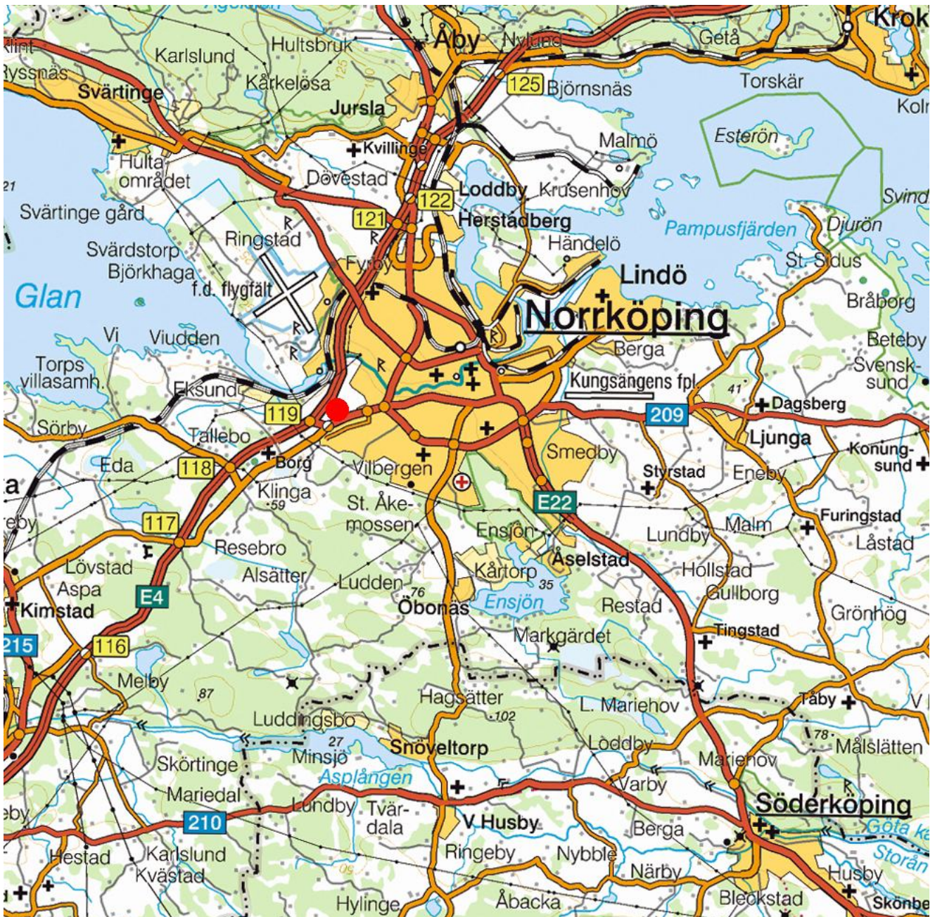
Figur 1. Översikt av området runt Norrköping. Undersökningsområdet är markerat med en röd prick. Skala 1:100 000.