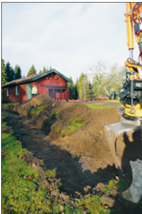
Figur 6. Vy över schakt S202 från sydöst.