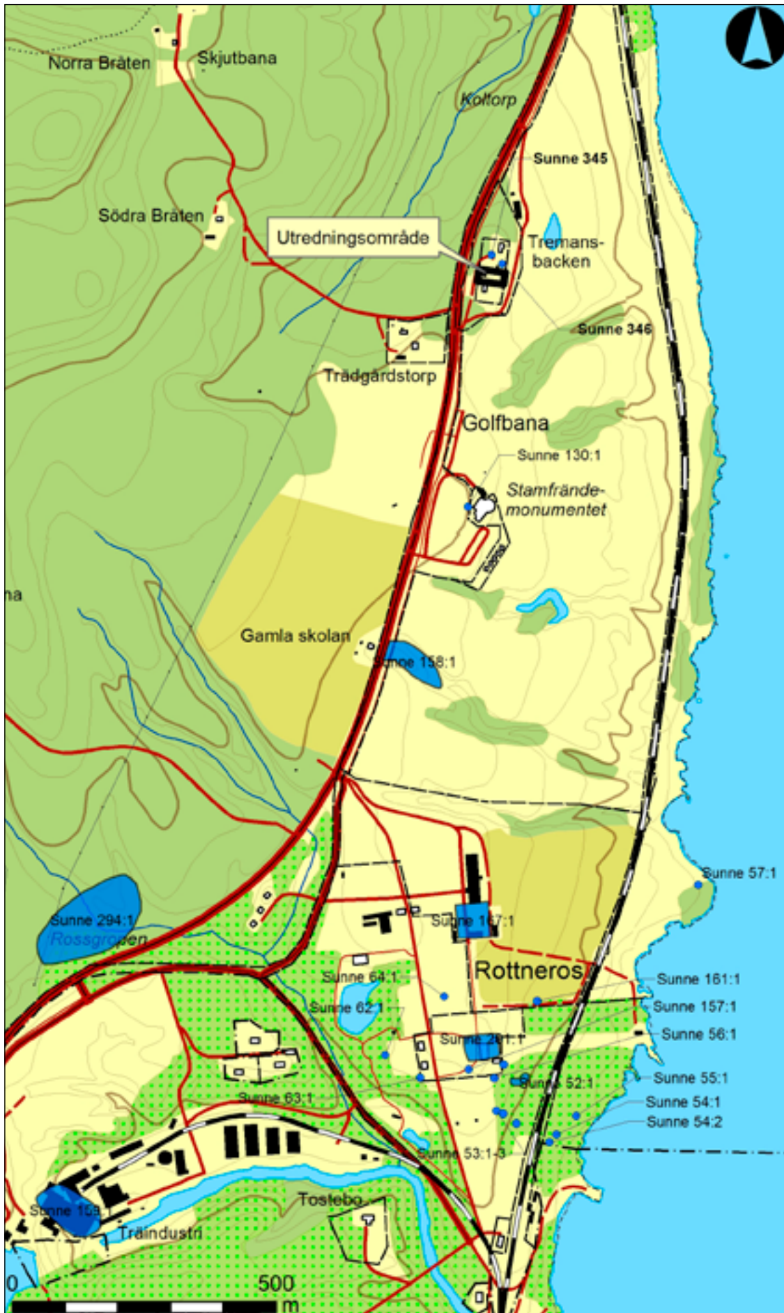
Figur 2. Karta över trakten strax norr om Rottneros med utredningsområdet markerat. Skala 1:10 000.