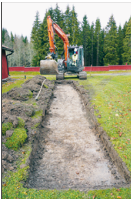
Figur 7. Vy över schakt S204 från öster.