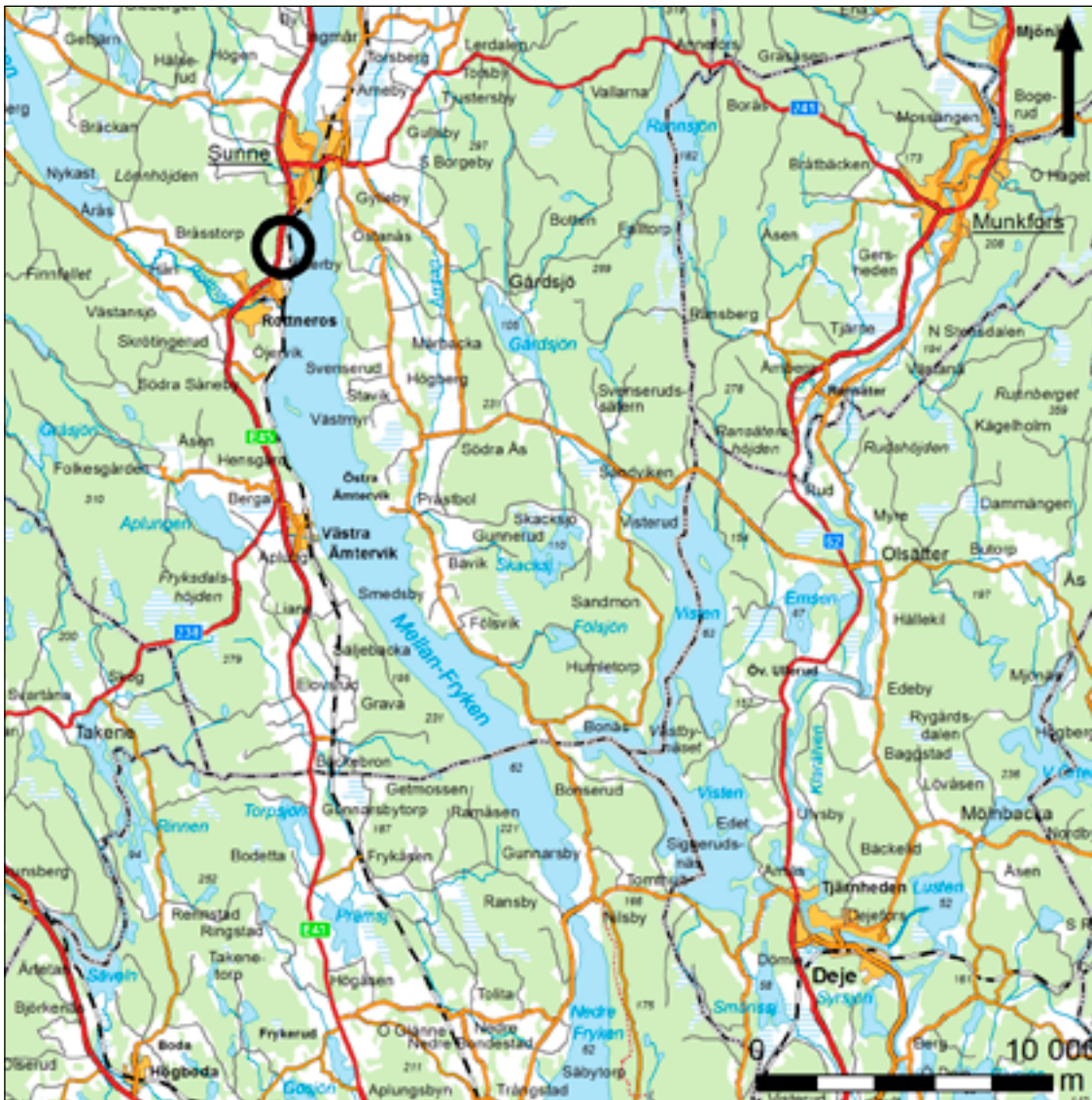
Figur 1. Karta över trakten kring Rottneros med den aktuella undersökningsplatsen markerad med en röd ring. Skala 1:250 000.