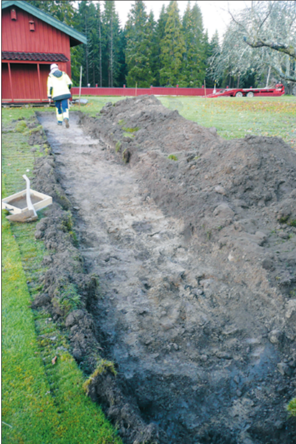
Figur 5. Vy över schakt S200 från öster.

Inga spår efter fornlämningar kunde iakttas, inga anläggningar från bosättning eller några förhistoriska fynd.