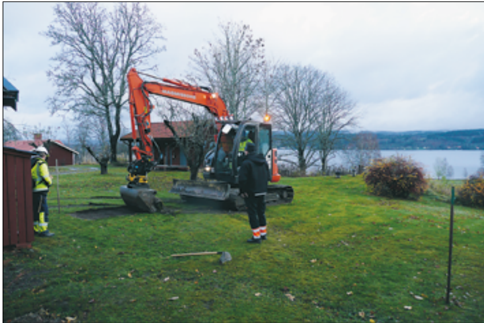
Figur 3. Vy över utredningsområdet från sydväst, strax efter påbörjad utredningsgrävning.

Då ingen fornlämning framkom gjordes inga provtagningar.