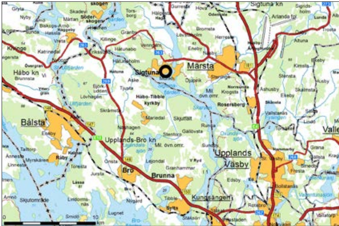
Figur 1. Karta över trakten kring Sigtuna med den aktuella undersökningsplatsen markerad med en röd prick. Skala 1:250 000.