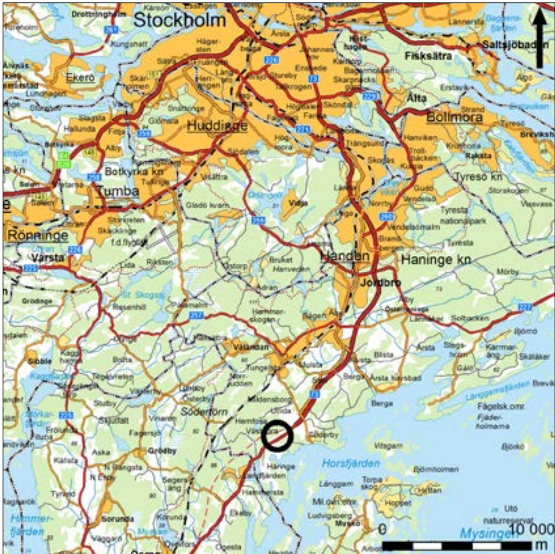
Figur 1. Karta över trakten kring Västnora med den aktuella undersökningsplatsen markerad med en röd prick.