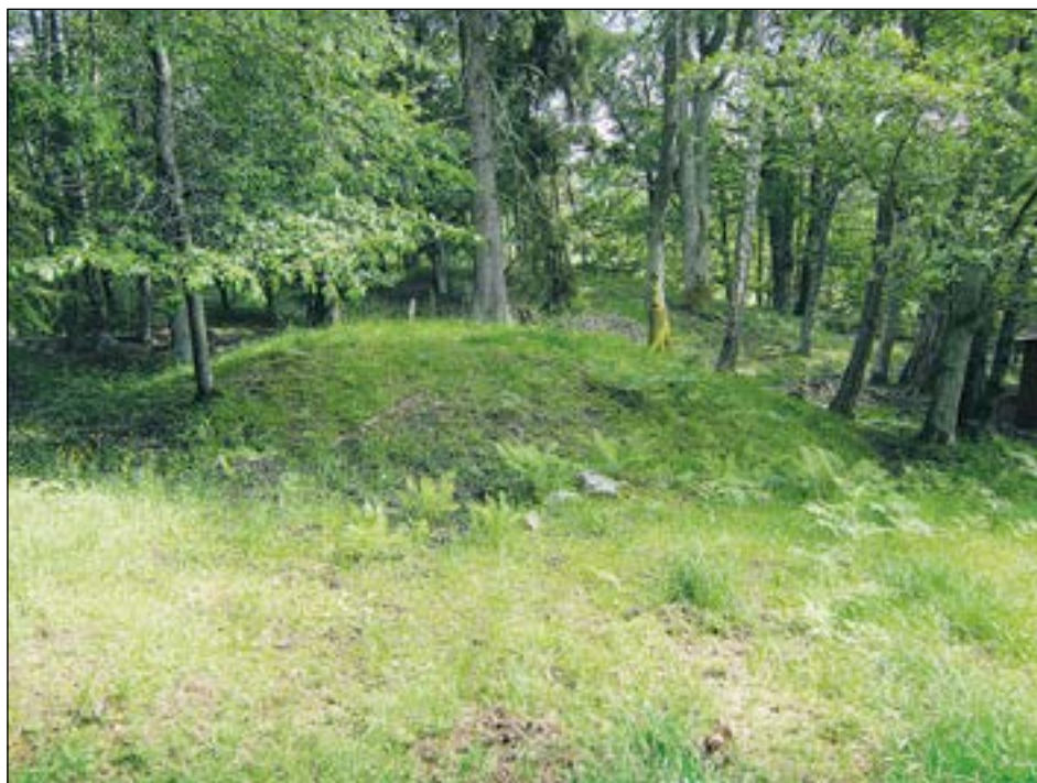
Figur 4. En av storhögarna på gravfältet 165:1.

Inför utredningsgrävningen gjordes en mycket översiktlig kontroll av det äldre kartmaterial som finns i digital form på Lantmäteriets hemsida. Av en storskifteskarta från 1771 framgår att det aktuella området då ingick i en beteshage som hörde till Västnora by. Omedelbart öster om hagen låg ett båtsmanstorp med tillhörande täppor, som dock inte berördes av utredningen. En enskifteskarta från 1808 visar samma bild. Dagens bebyggelse återfinns i den nordvästra kanten av den gamla beteshagen.