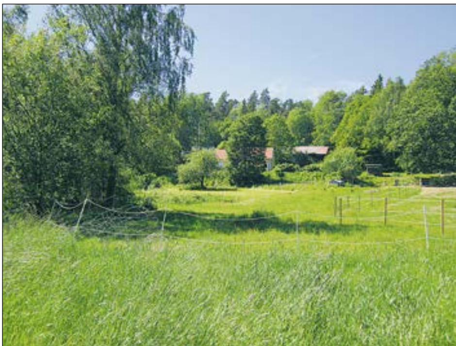
Figur 3. Översikt. Utredningsområdet återfinns nedanför huset, vid det höga trädet.

Enligt Fornsök är Västerhaninge 150:1 en stenåldersboplats, känd genom att talrika keramikskärvor påträffats inom en äldre åkeryta. Till lämningen räknas även en tunnackig yxa av bergart som uppges vara hittad "ca 75 m NO om fastigheten Västnora 4:23".