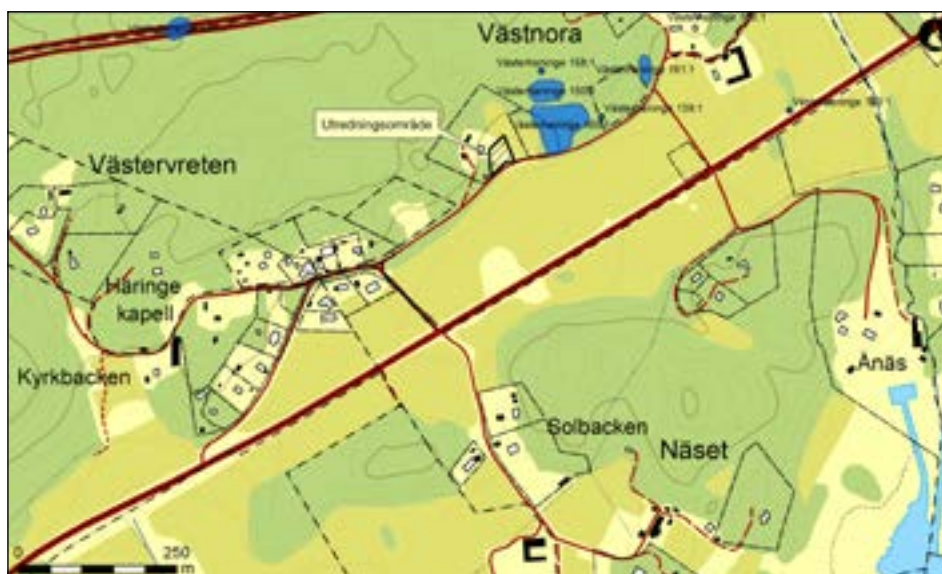
Figur 2. Närmiljö kring Västnora med fornlämningar enligt Fornsök markerade.

Länsstyrelsen ville ha klarlagt om närliggande fornlämningar RAÄ Västerhaninge 150:1, 158:1 och 165:1 utsträckte sig till den planerade avstyckningen. Åtta schakt med en sammanlagd längd av 67 löpmeter upptogs inom undersökningsområdet. Inget av schakten innehöll spår av äldre lämningar.