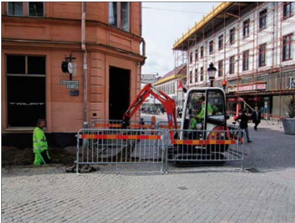
Figur 3. Slutpunkt för schaktet.