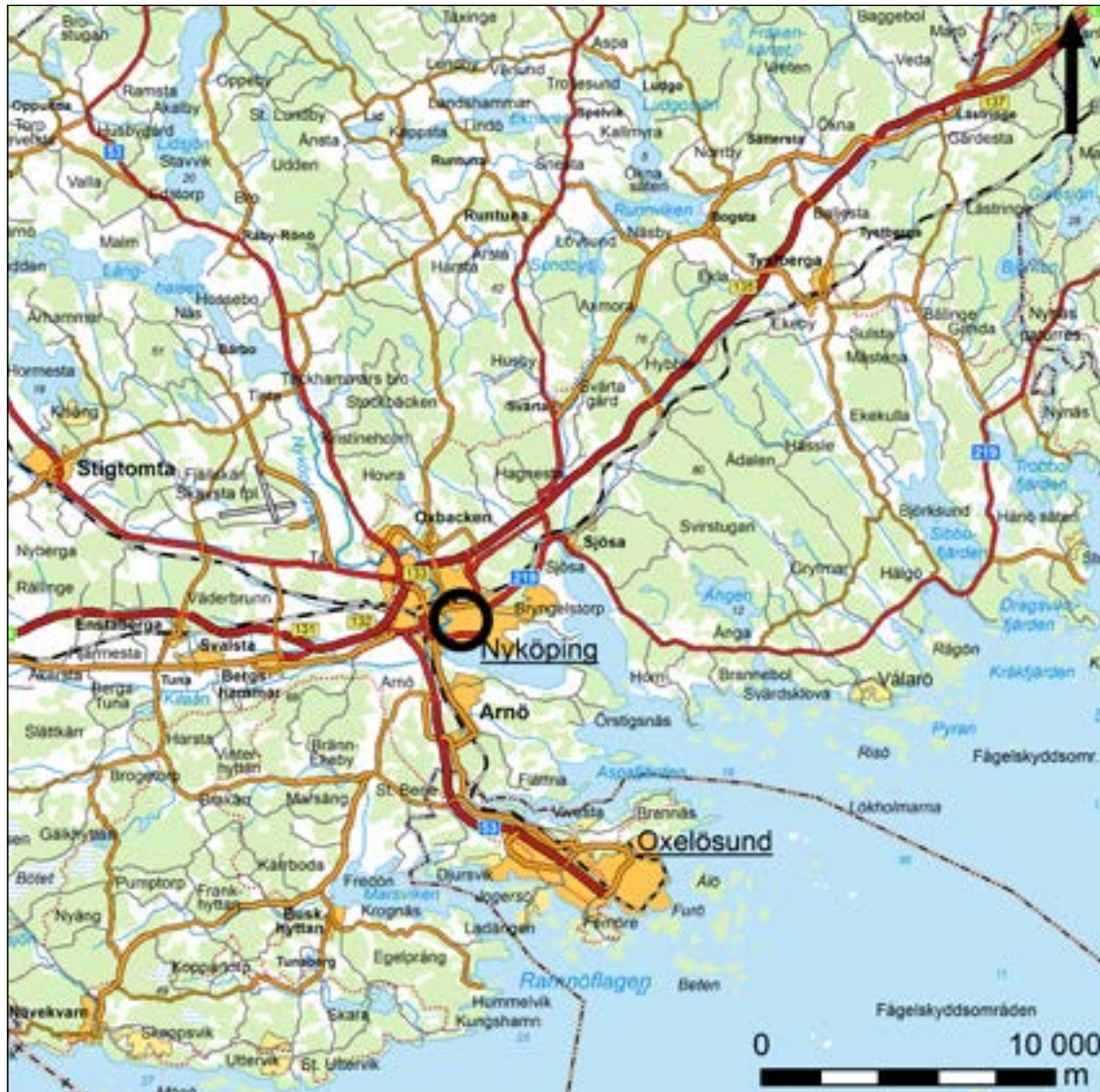
Figur 1. Karta över trakten kring Nyköping.