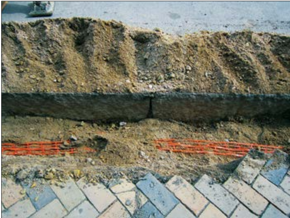
Figur 4. Kantsten av den typ som följde hela schaktet.