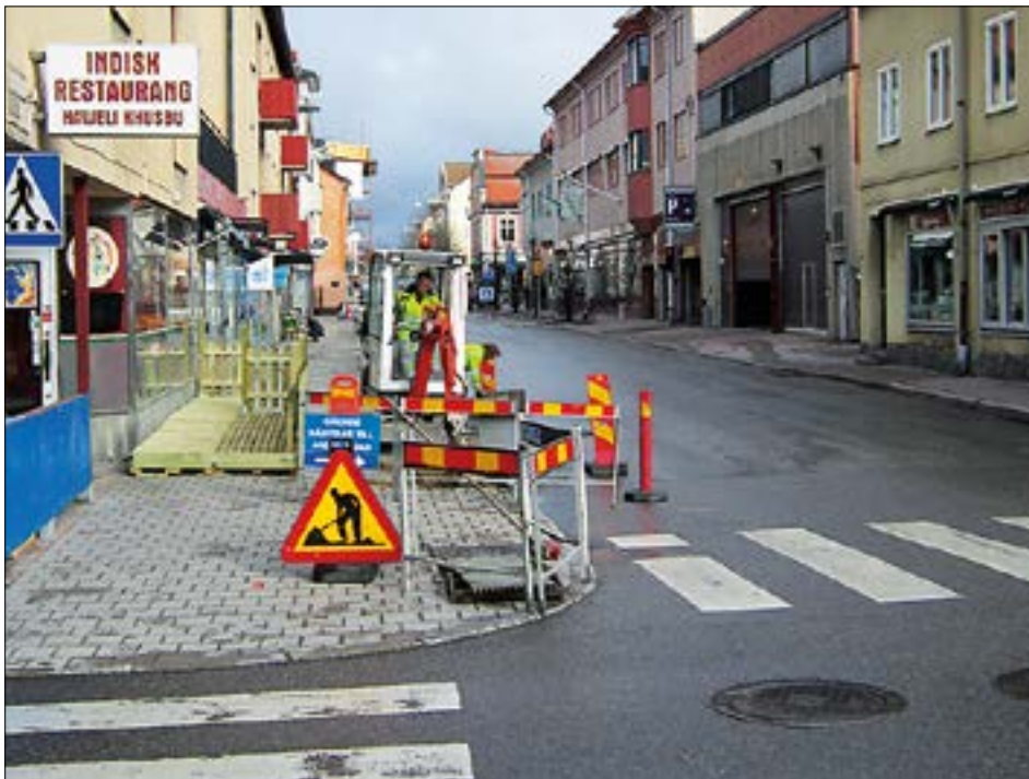
Figur 2. Startpunkt för schaktet.