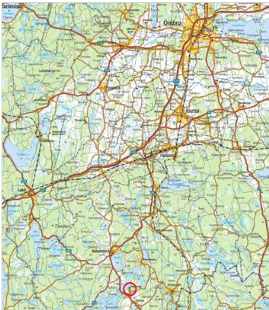
Figur 1. Utdrag ur översiktskartan över trakten kring Hammars kyrka med den aktuella undersökningsplatsen markerad med en röd cirkel.