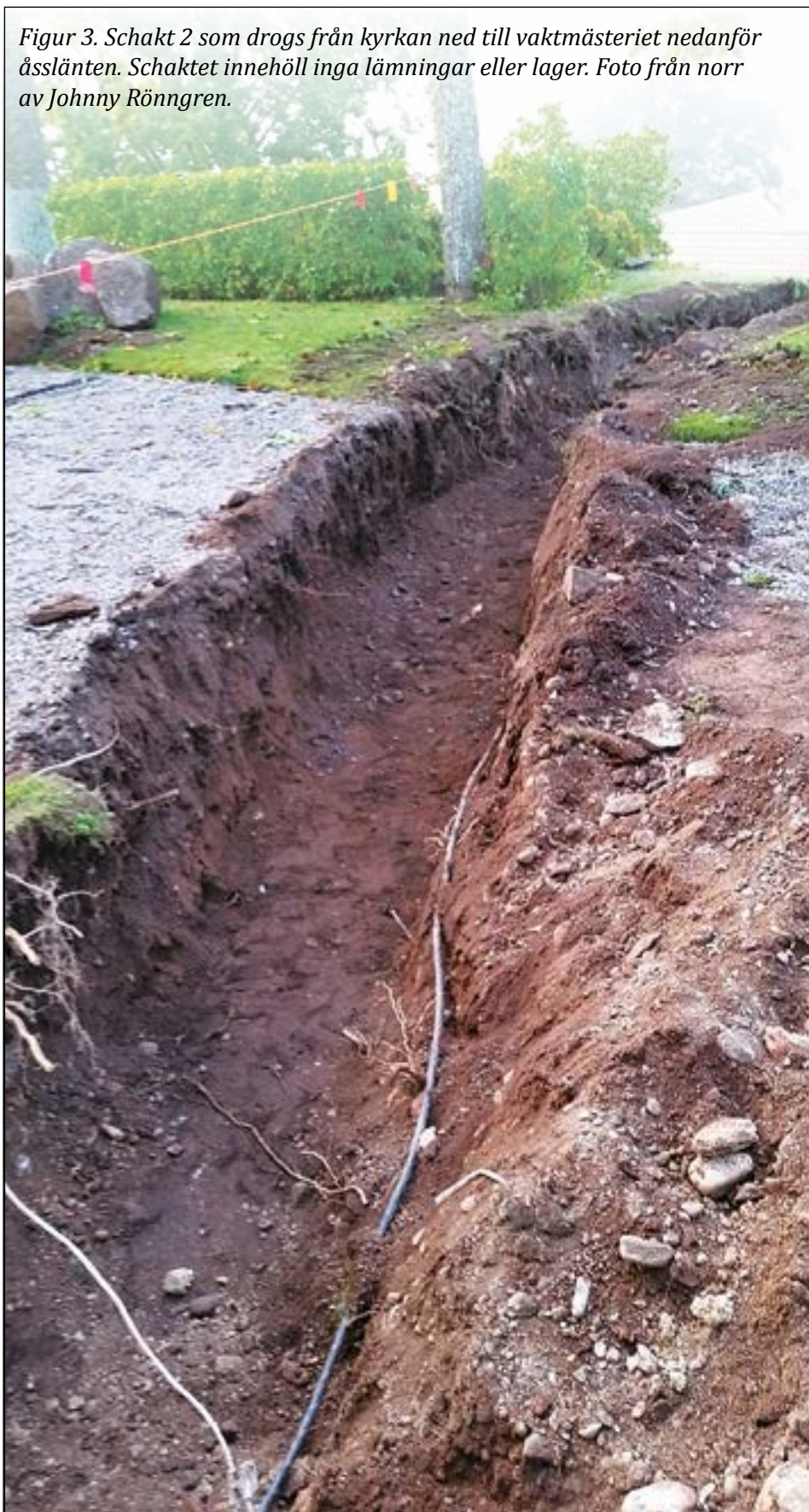
Figur 3. Schakt 2 som drogs från kyrkan ned till vaktmästeriet nedanför åsslätten. Schaktet innehöll inga lämningar eller lager. Foto från norr av Johnny Rönngren.