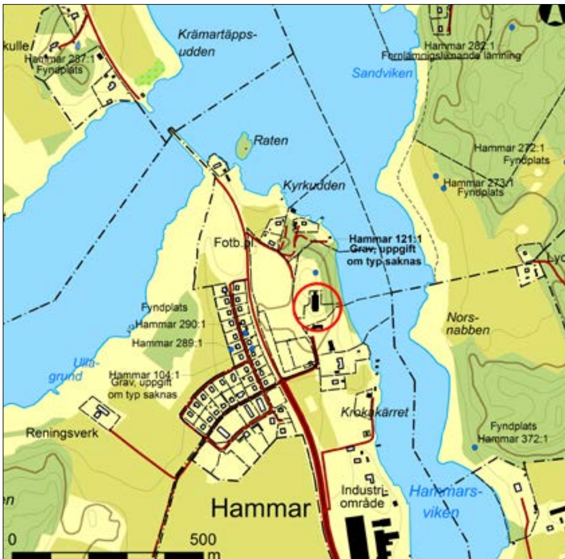
Figur 2. Utdrag ur fastighetskartan med omgivande fornlämningar och den aktuella undersökningsområdet markerat med en röd cirkel. Skala 1:10 000.

att den nuvarande kyrkan anlades. Ett numera förkommet tveeggat bronssvärd ska ha påträffats i ett grustag på kullen (se Fornsök). Även muntliga skrönor gör bland annat gällande att en hjälte vid namn Hjalmar, som slagit följe med Olof den Helige, skulle ha legat begravd på kullen (Saxon 1928:163). Det är troligt att ett förhistoriskt gravfält tidigare funnits på åsen och det är oklart hur mycket av det som finns bevarat.