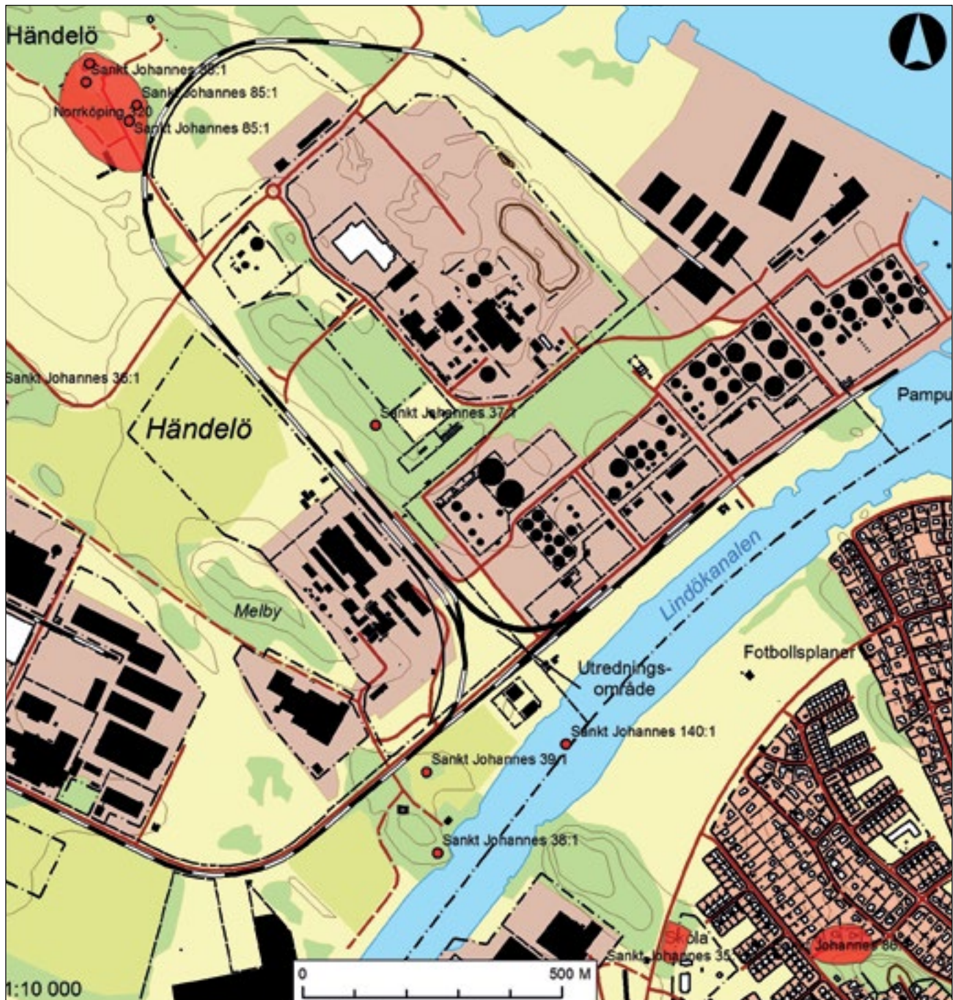
Figur 2. Karta över trakten kring Händelö med det aktuella utredningsområdet markerat med ett svart streck.