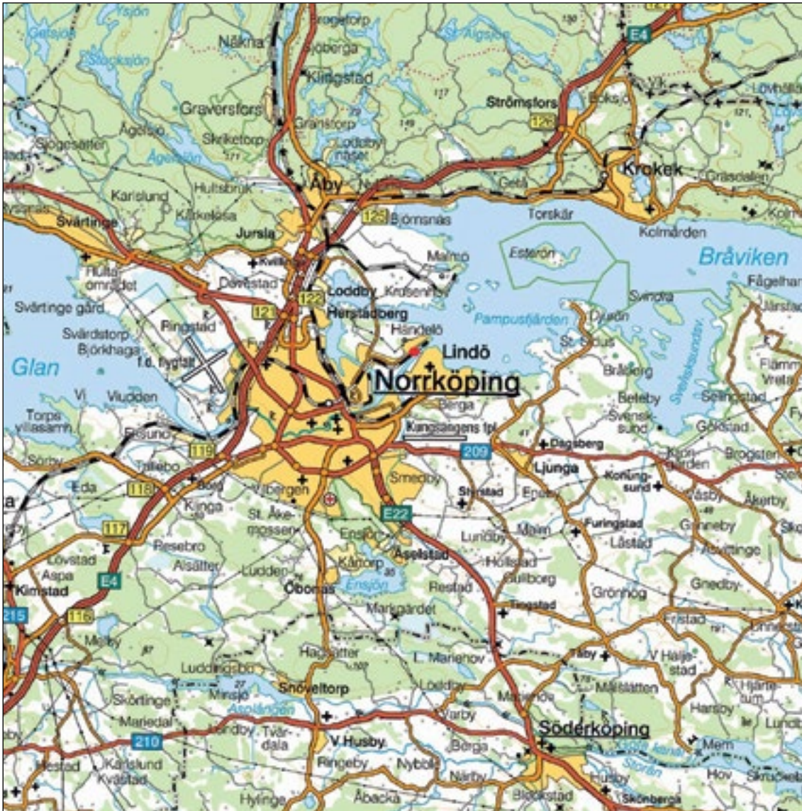
Figur 1. Karta över Norrköping med utredningsområdet i Händelö markerad med röd prick.