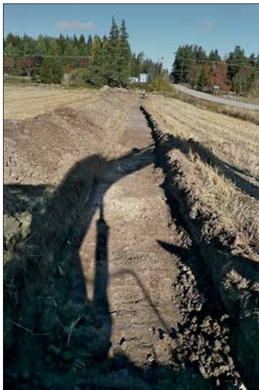
Figur 4. Vy över schakten. Foto från söder av Leif Karlenby.

Schaktet genom stensträngen visade att den bestod av sprängsten som grävts ned till en meters djup. Det är tveksamt om just detta parti av stensträngen är av särskilt hög ålder. Utifrån våra mätningar förefaller den dessutom vara fel inmätt i Fornsök (tillika Björksta 556; se figur 3).