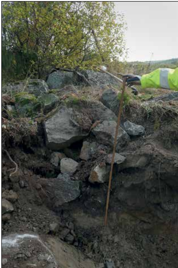
Figur 5. Sektion över stensträngen eller hägnaden Björksta 8:1 från väster. Hela anläggningen bestod av stora sprängsten och var djupt nedgrävd i marken.

Arkeologgruppen AB anser därför att undersökningsplanens syfte och frågeställningar har uppfyllts.