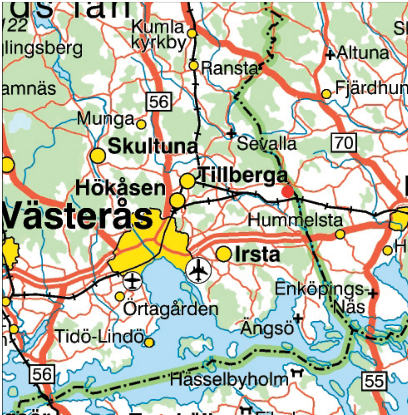
Figur 1. Karta över trakten kring Kärsta, Björksta socken med den aktuella undersökningsplatsen markerad med en röd prick.