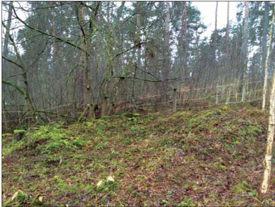
Figur 5. Vallanläggningen från norr. Vallen framträder svagt i det höga gräset.

Ingen fornlämning framkom inom schaktet. Invid schaktet påträffades en vallanläggning som möjligen kan vara en fornlämning. Denna berördes dock ej av arbetena och undersöktes inte.