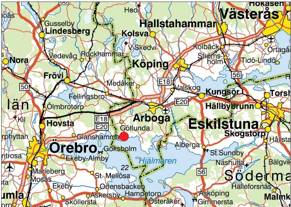
Figur 1. Karta över trakten kring Götlanda och Lunger med den aktuella undersökningsplatsen markerad med en röd prick.