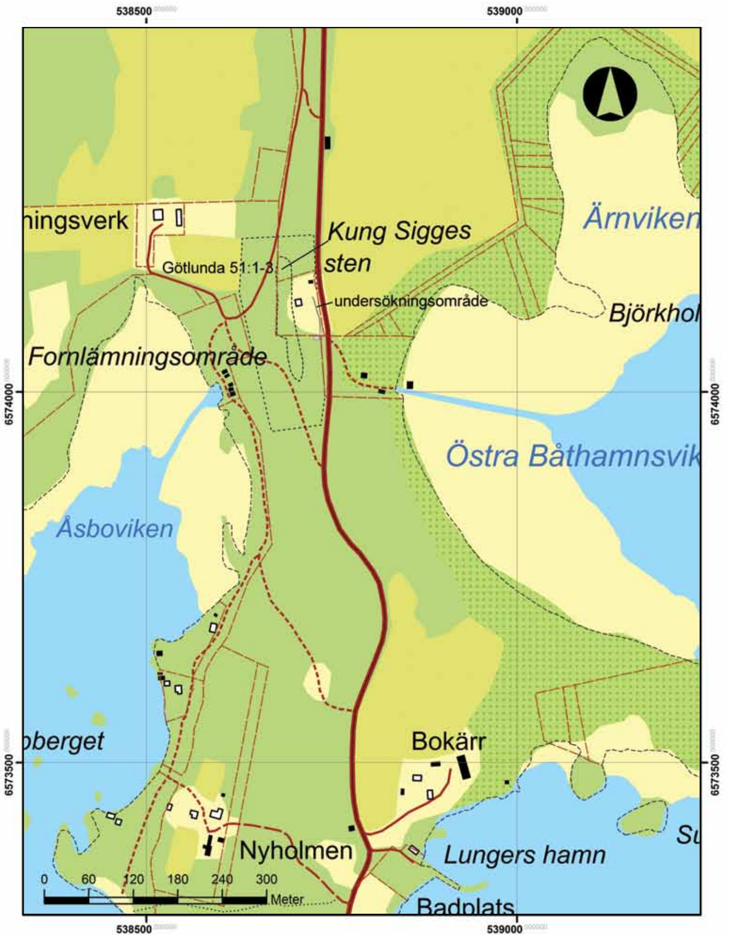
Figur 2. Karta över den norra delen av Lungers udde. Platsens för den arkeologiska övervakningen är utmärkt med ett streck. Skala 1:5 000.