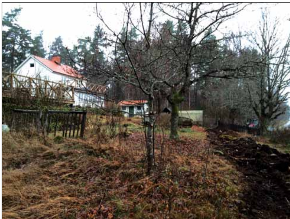
Figur 3. Vy över trädgården och den norra delen av schaktet. Foto från söder av Leif Karlenby.

Den antikvariska kontrollen och dokumentationen skulle omfatta inmätning av schakten och den skulle endast omfatta de sträckor som markerats på en, till förfrågningsunderlaget bifogad, karta. En arkeolog skulle delta vid schaktningen, undantaget de ytor där detta bedömdes onödigt.