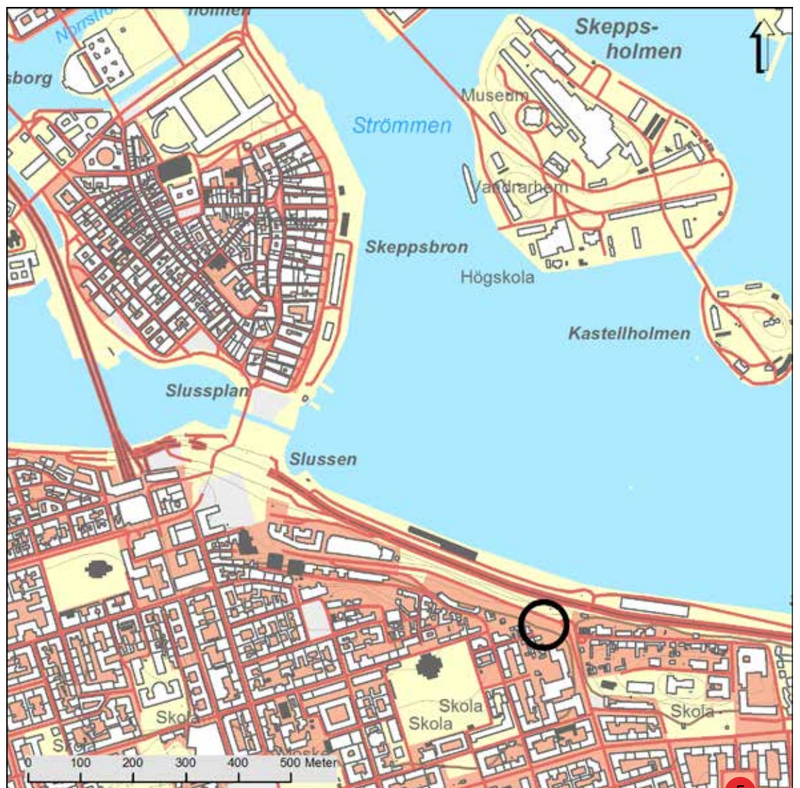
Figur 2. Plats för schaktet på Södermalm markerat med en svart ring. Skala 1:10 000.

Med anledning av att en elkabel skulle repareras har Arkeologgruppen AB utfört en schaktövervakning på Mäster Mikael's gata i kvarteret Klinten på Södermalm i Stockholm. Arbetet utfördes av Infratek AB på uppdrag av Ellevio AB som även ansvarade för kostnaden för den arkeologiska övervakningen.