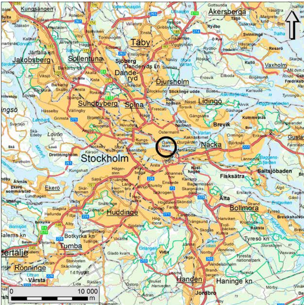
Figur 1. Karta över Stockholmstrakten med den aktuella undersökningsplatsen markerad med en svart ring. Skala 1:250 000.