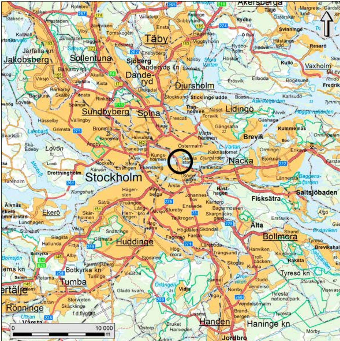
Figur 1. Översiktskarta över Mantorp med den aktuella utredningsplatsen markerad med rött. Skala 1:250 000.