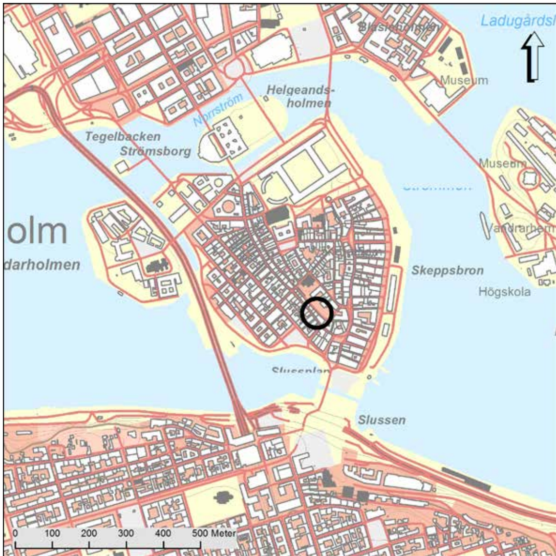
Figur 2. Gamla stan med undersökningsområdet markerat med en svart ring. Skala 1:15 000.