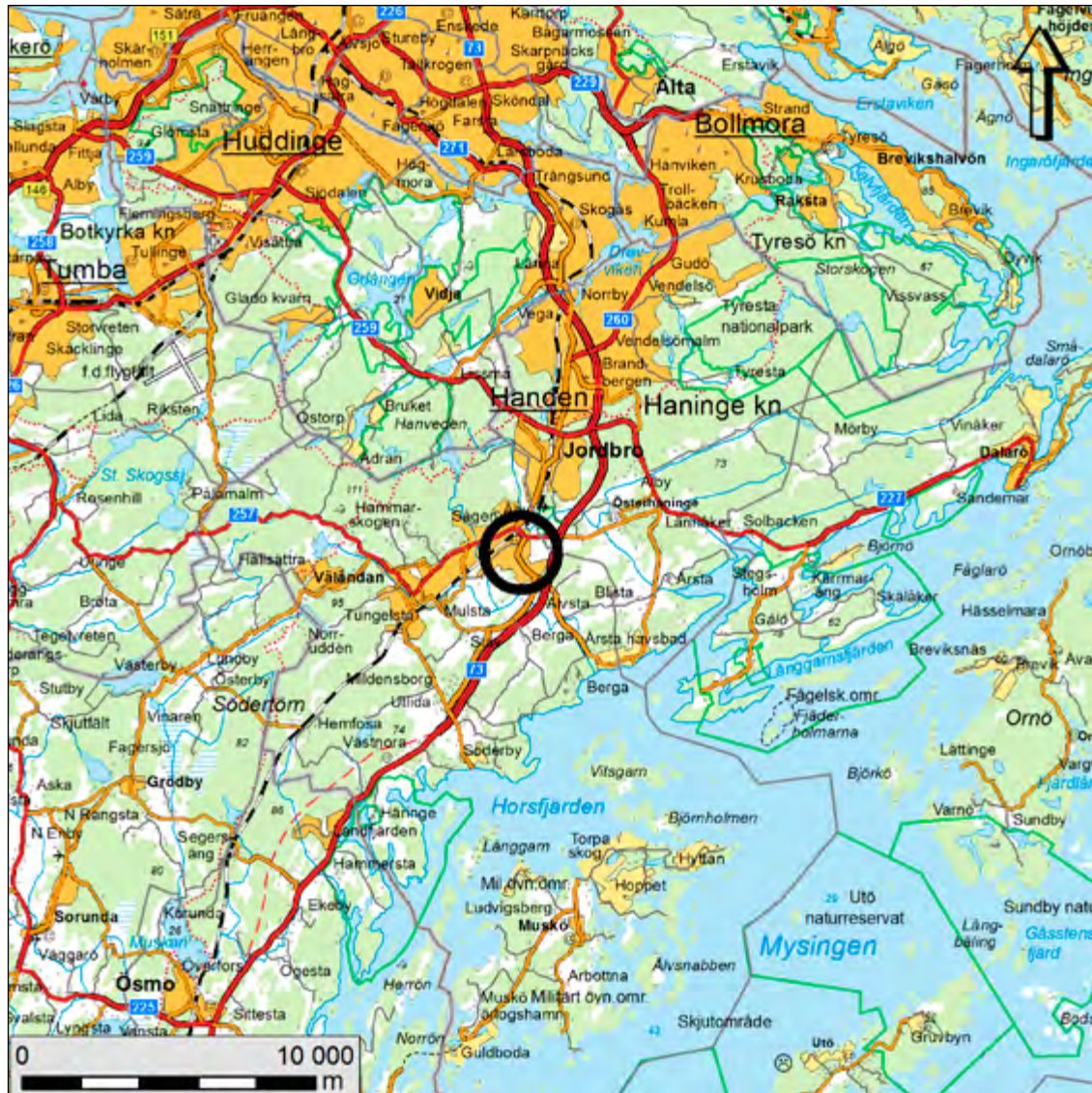
Figur 1. Översiktskarta med den aktuella undersökningsplatsen markerad med rött. Skala 1:250 000.