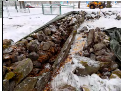
Figur 3. Foto över nedplockad del av den sydöstra sidan av muren.