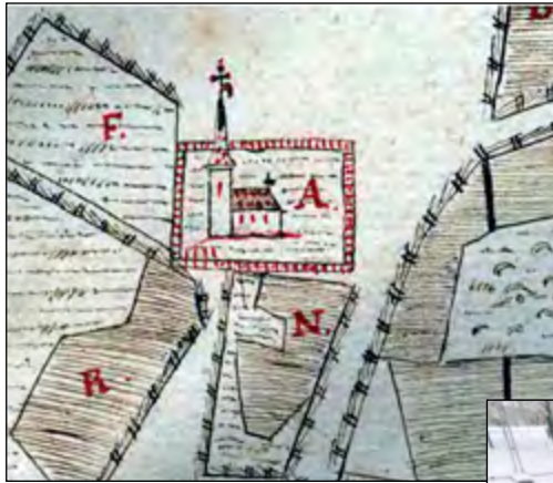
Figur 3. Utdrag ur den geometriska kartan från år 1638 med Västerhaninge kyrka och bogårdsmuren.