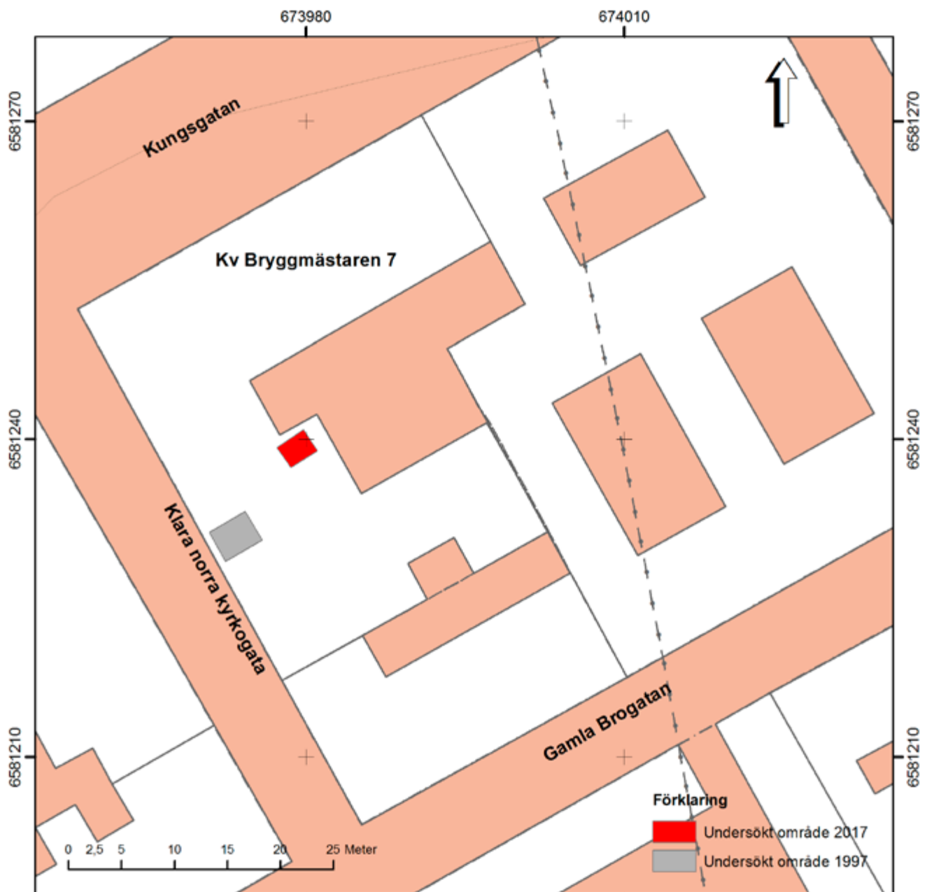
Figur 3. Karta över Kv Bryggmästaren 7 med den aktuella undersökningsplatsen markerad och ungefärlig plats för undersökningen 1997. Skala 1:500.