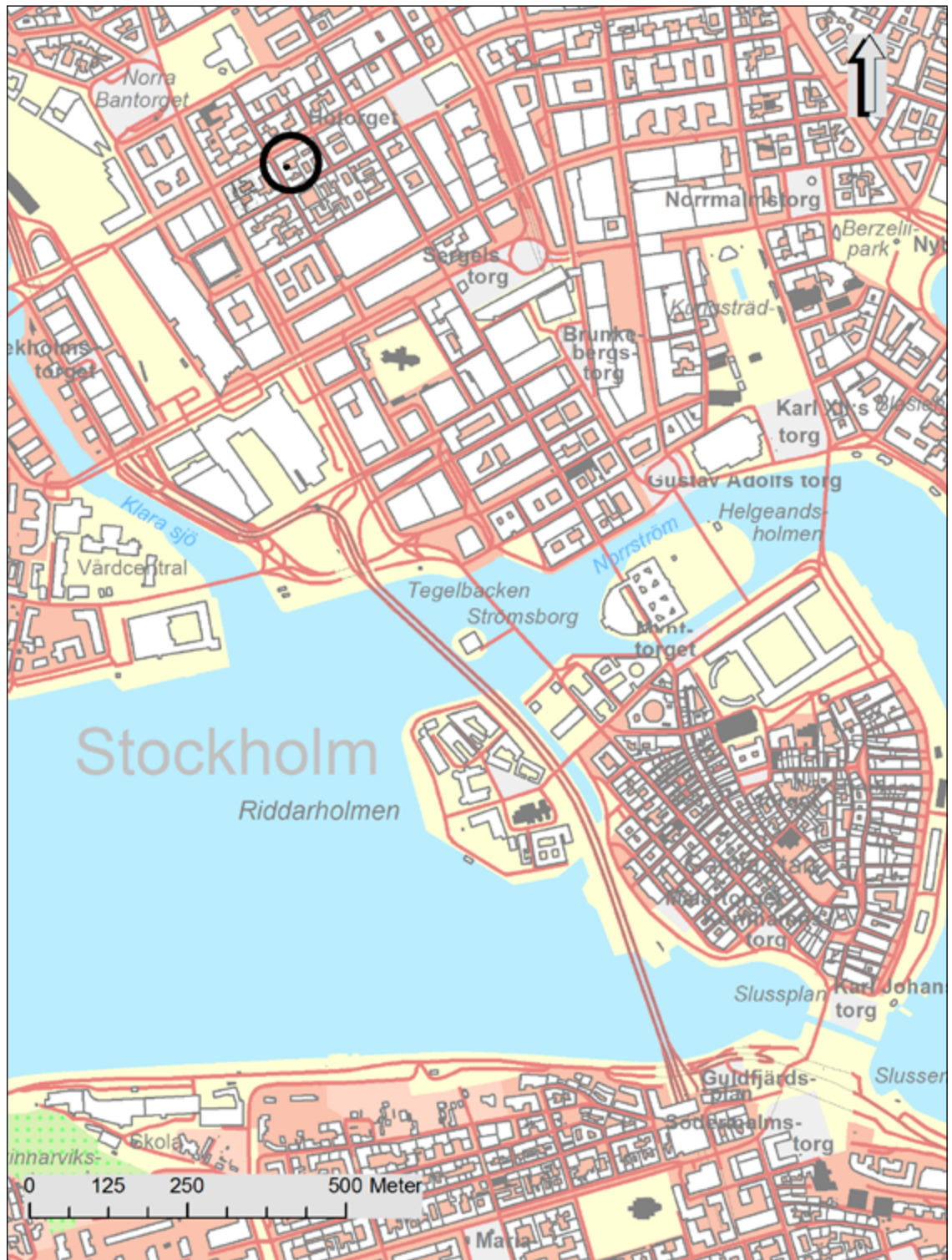
Figur 2. Karta över Stockholm med Kv Bryggmästaren 7 markerad med en svart ring. Skala 1:10 000.