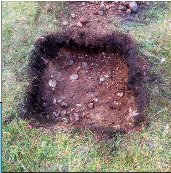
Figur 3. Typexempel på hur groparna såg ut.