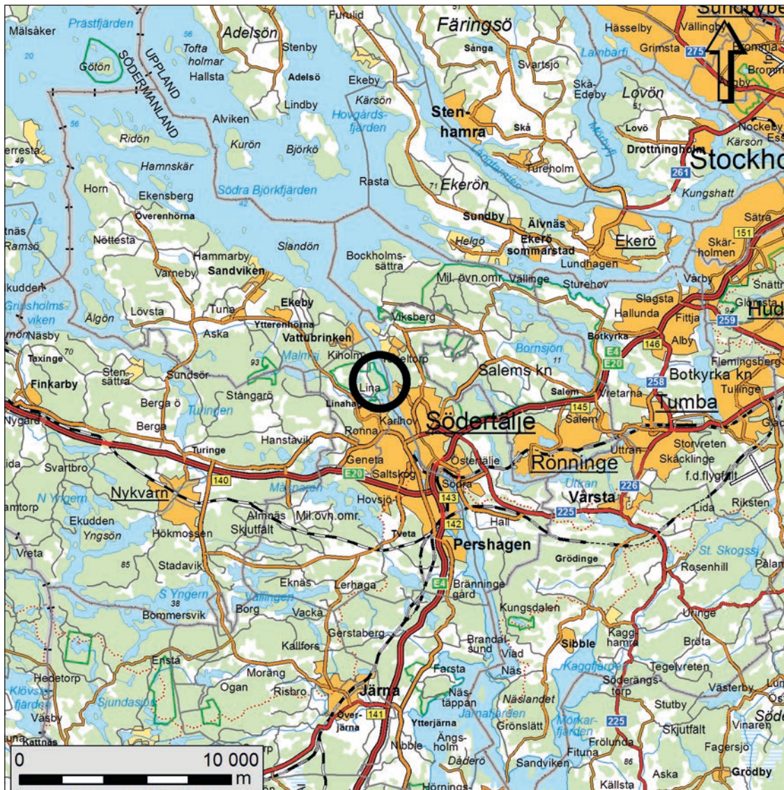
Figur 1. Karta över trakten kring Täljehus med den aktuella undersökningsplatsen markerad med en svart ring.