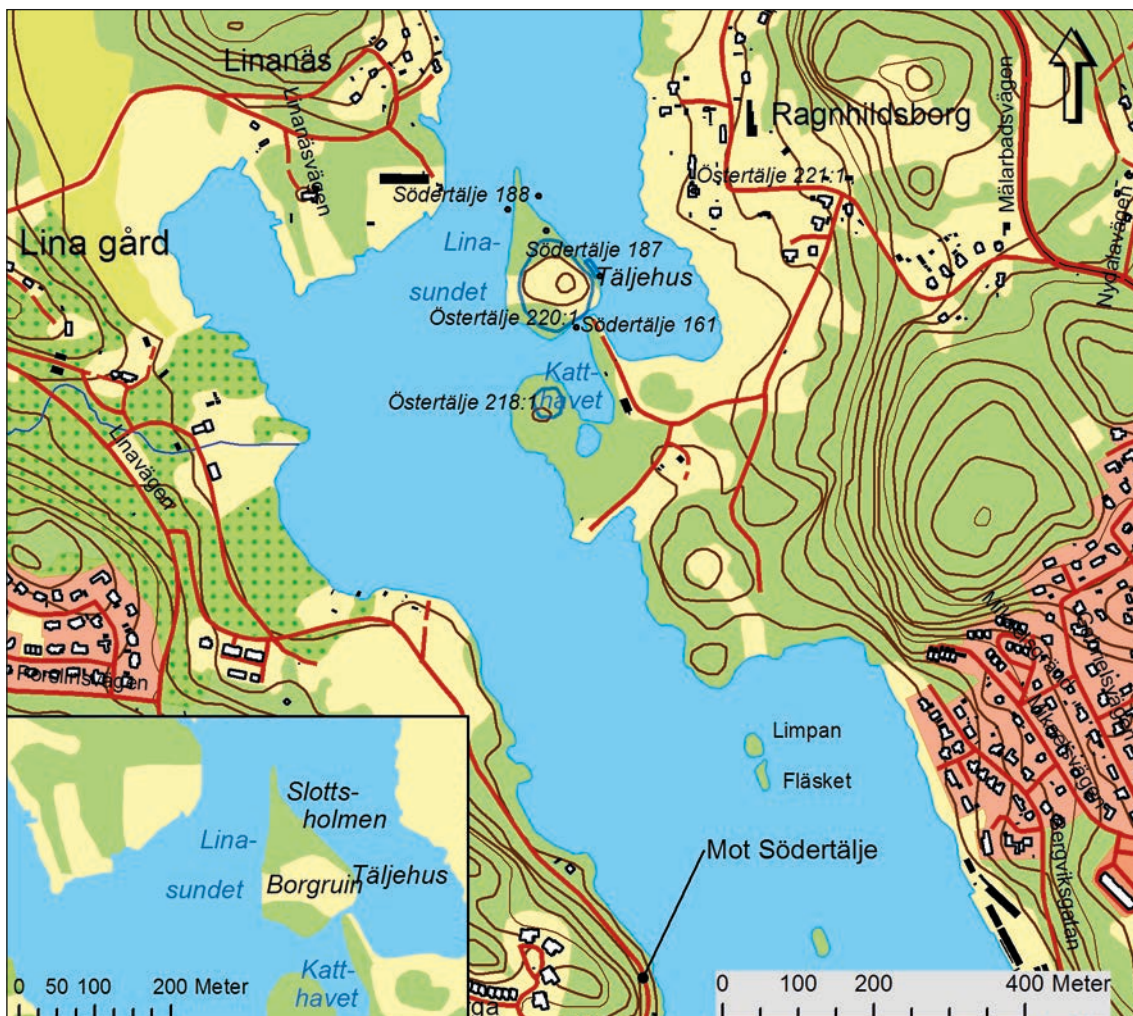
Figur 2. Utdrag ur Fastighetskartan som visar Täljehus samt närliggande område. Skala 1:10 000.