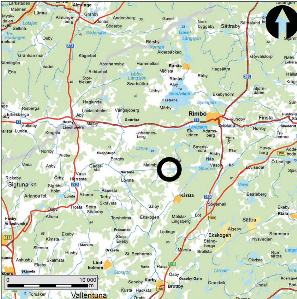
Figur 1. Karta över trakten kring Närtuna-Ubby med den aktuella undersökningsplatsen markerad med en svart cirkel. Skala 1:250 000.