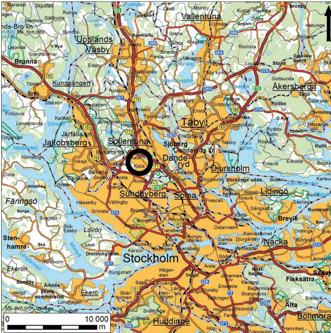
Figur 1. Karta över trakten kring Kista äng med den aktuella undersökningsplatsen markerad med en svart ring.