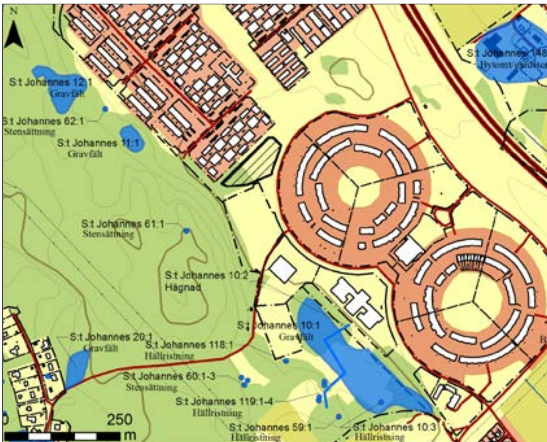
Figur 2. Karta med fornlämningar i närheten till den förundersökta ytan enligt Fornsök.