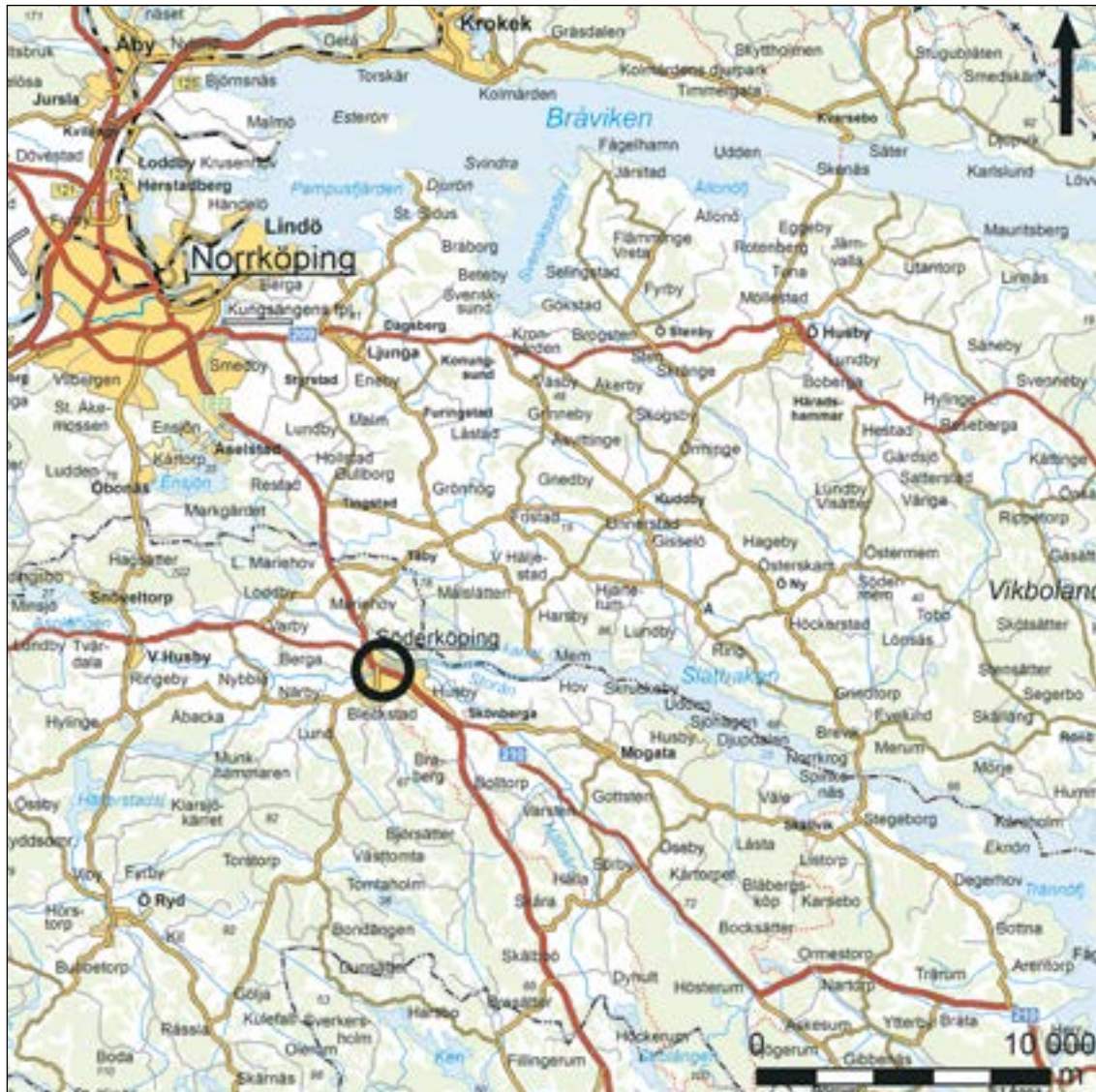
Figur 1. Karta över trakten kring Söderköping med den aktuella undersökningsplatsen markerad med en svart cirkel. Skala 1:250 000.