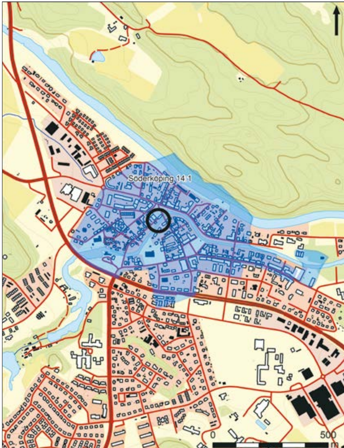
Figur 2. Platsen för undersökningen markerad med en svart cirkel. Skala 1:10 000.

Två små schakt vid rådhuset i Söderköping