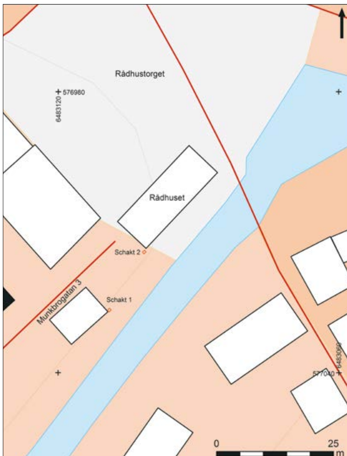
Figur 4. Schaktplan över schakten som grävdes vid rådhuset. Skala 1:500.

De frågor som ställdes inför undersökningen har besvarats och inga avvikelser från undersökningsplanen har gjorts. I den mån som det har varit möjligt har utbredningen av kulturlager fastställts, dess ålder och karaktär bestämts. Inga medeltida lager eller anläggningar framkom utan endast en stenfyllning från 1800-talet berördes.