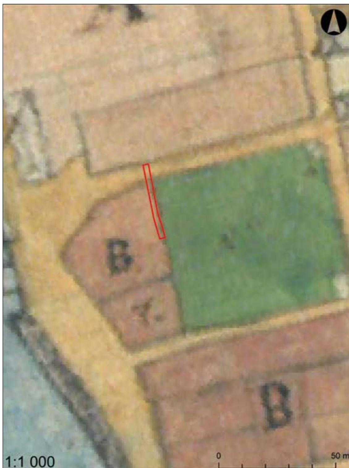
Figur 4a. Här kan man se att schaktet ligger utanför kyrkogårdens utbredning sådan den var år 1773.

I samband med byggnationen av Askersunds bryggeri hade ungefär halva ytan mellan denna byggnad och kyrkogården schaktats ur. Öster om den ytan fanns den naturliga backen bevarad. Denna sluttade kraftig åt väster och har förmodligen utgjort en naturlig strandbrink. Påfört över backen låg ett 0,7–1,1 meter tjockt lager med matjord. Det utgjorde förmodligen ett försök att höja upp de västligaste delarna av