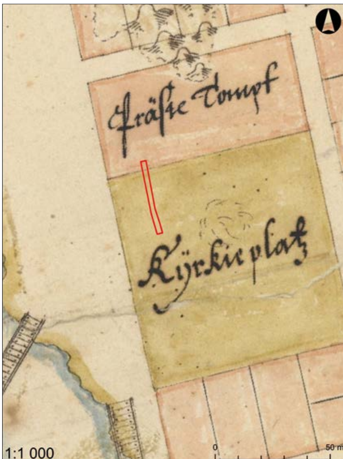
Figur 4b. Schaktet inlagt mot en rektifierad version av år 1643 års karta. Här ligger schaktet inom det som kallas "Kyrkieplatz". Denna utbredning behöver kyrkogården aldrig ha haft. Kartan är snarare en plan för hur man tänkt sig stadens utbredning än vad den slutligen blev.

kyrkogården. I fyllningen fanns ingenting annat än jord. I anslutning till urschaktningen för bryggeriet fanns en del byggrester. I den norra delen av schaktet framkom ett överarmsben av människa. Detta kommer naturligtvis från kyrkogården, men torde ha hamnat i slänten vid någon typ av omgrävning av äldre gravar. Det rör sig om ett ben från en vuxen individ. Inga gravar eller delar därav påträffades i slutningen.