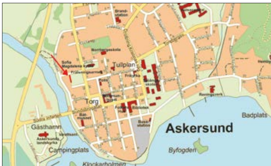
Figur 1. Karta över Askersund med den aktuella undersökningsplatsen markerad med ett rött streck (följ pilen).