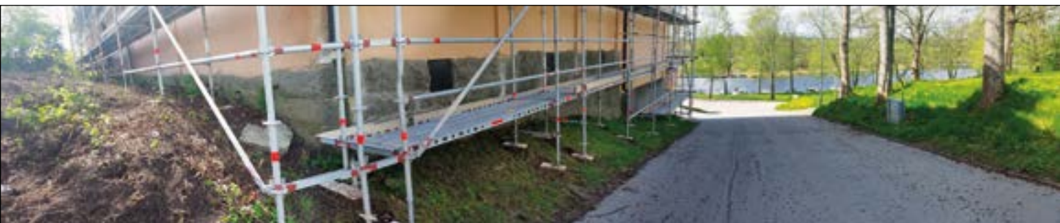
Figur 3. Panorama över undersökningsområdet och Norra kyrkogårdsgatan i slutningen ned mot Sundet.

En plan upprättades där utbredningen av den urschaktade delen ritades in. Två sektioner upprättades över den naturliga terrängens utseende och de påförda terrasseringsmassorna. Platsen fotograferades med digitalkamera.