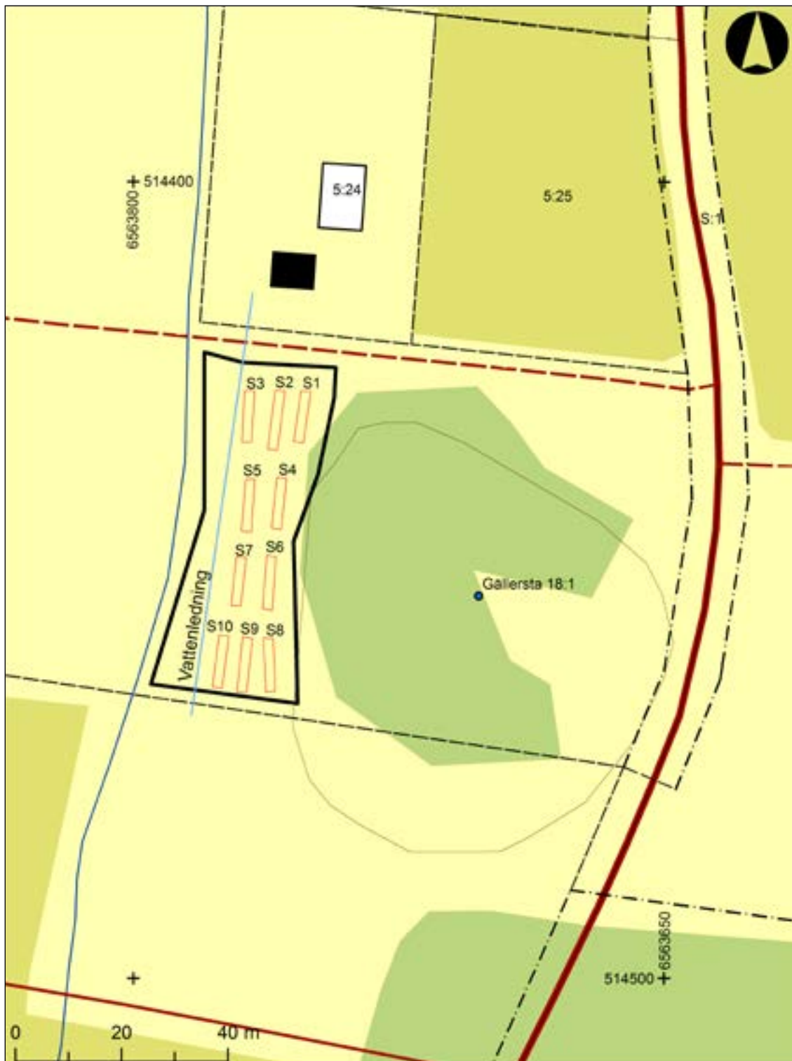
Figur 3. Schaktplan över schakten inom utredningsområdet. Placeringen av schakt begränsades av en befintlig vattenledning i nord-sydlig riktning. Skala 1:1 000.