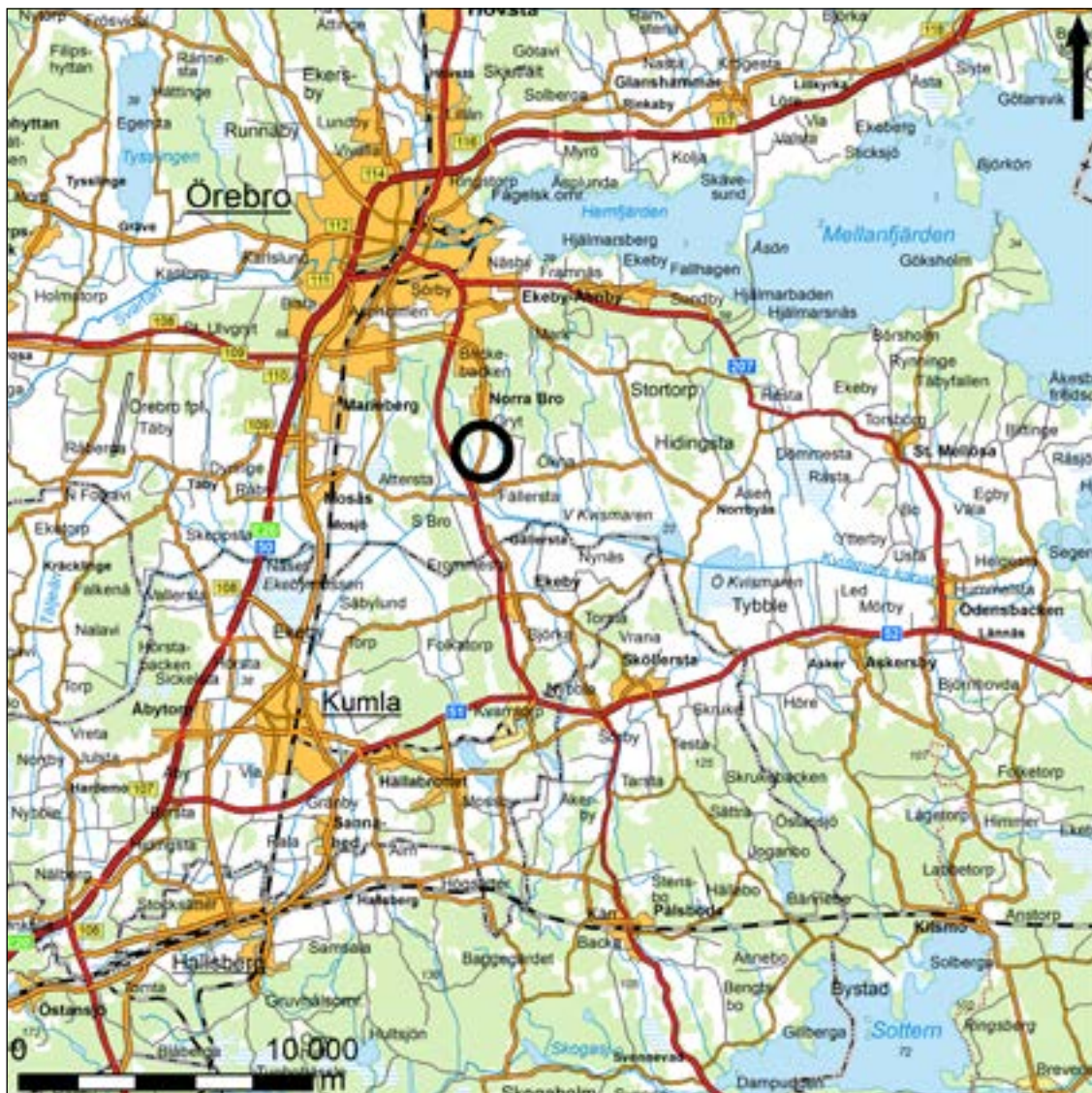
Figur 1. Karta över trakten kring Norra Bro med den aktuella undersökningsplatsen markerad med en svart cirkel. Skala 1:250 000.