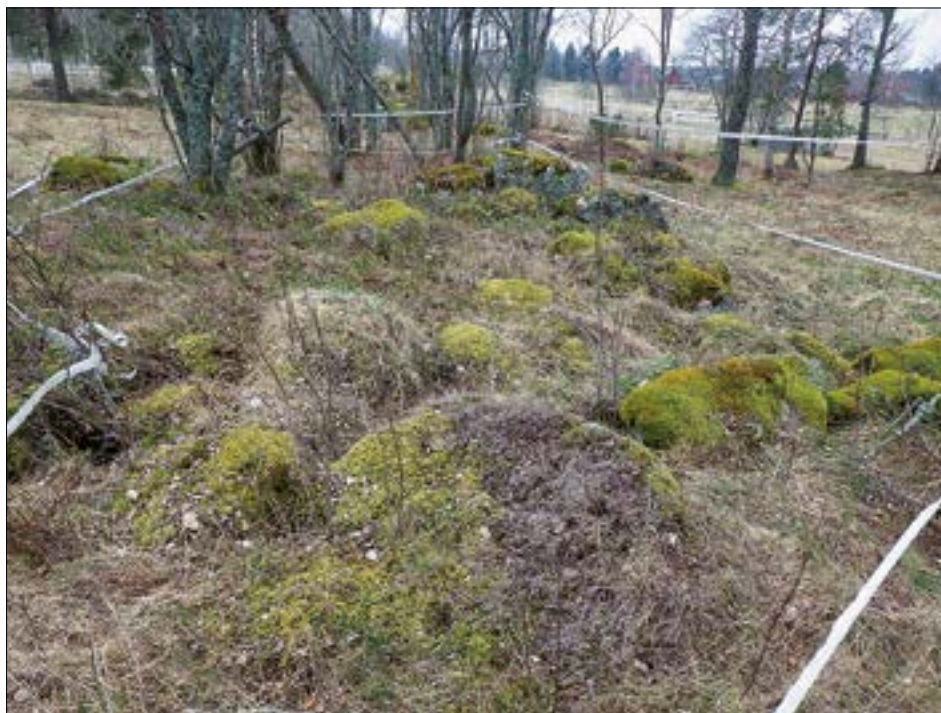
Figur 4. Den rektangulära stensättningen Gallersta 18:1, belägen på Skrehällaberget.

av blöt lerig sankmark som ej lämpat sig för en boplats. Frånvaron av arkeologiska lämningar vid utredningen talar även för att inga aktiviteter kan konstaterats som exempelvis kan knytas med graven (Gallersta 18:1), såsom kulthus, brännoffer eller dylikt.