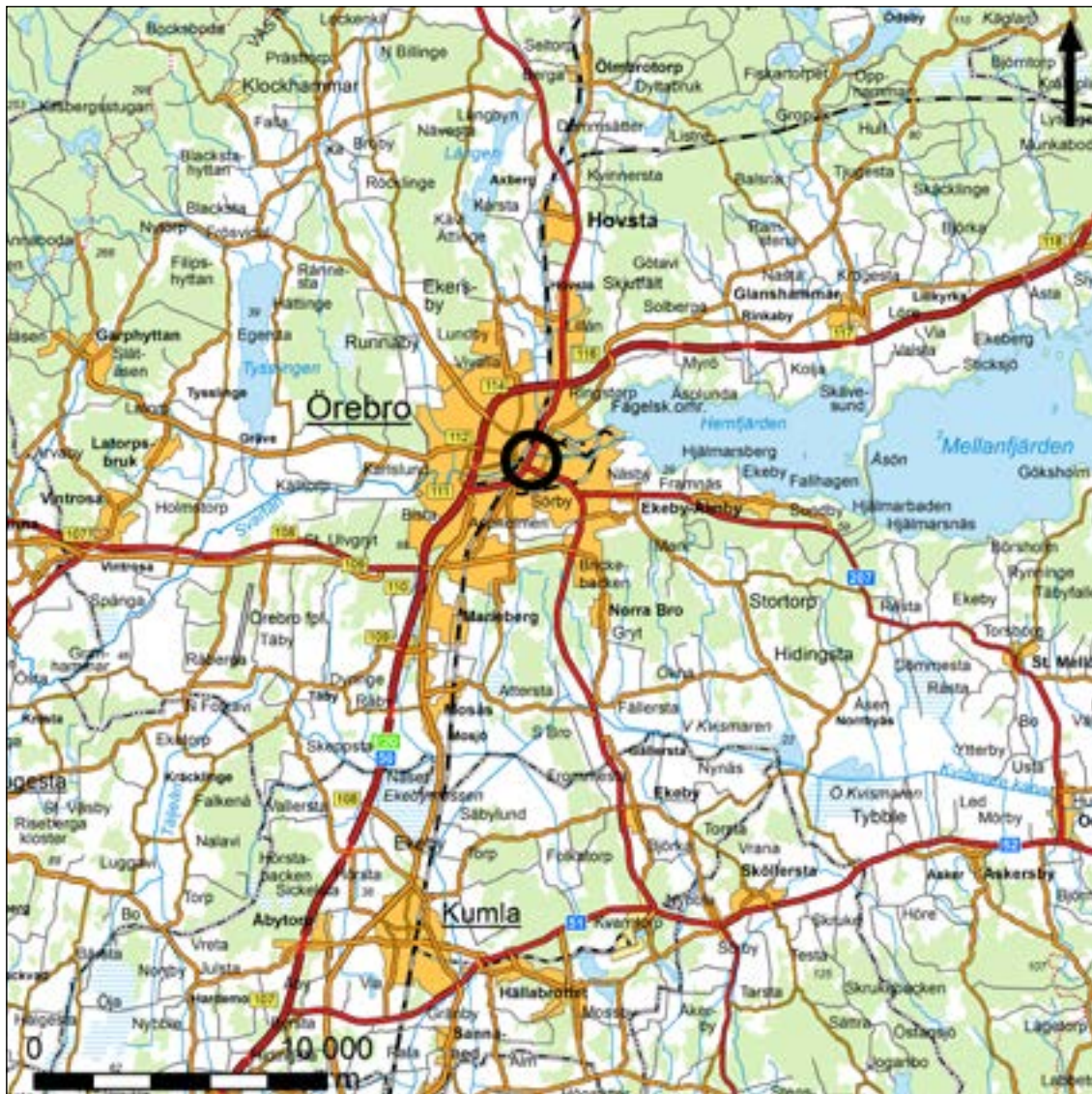
Figur 1. Utdrag ur översiktskartan som visar trakten kring Örebro med undersökningsplatsen markerad med en svart cirkel. Skala 1:250 000.