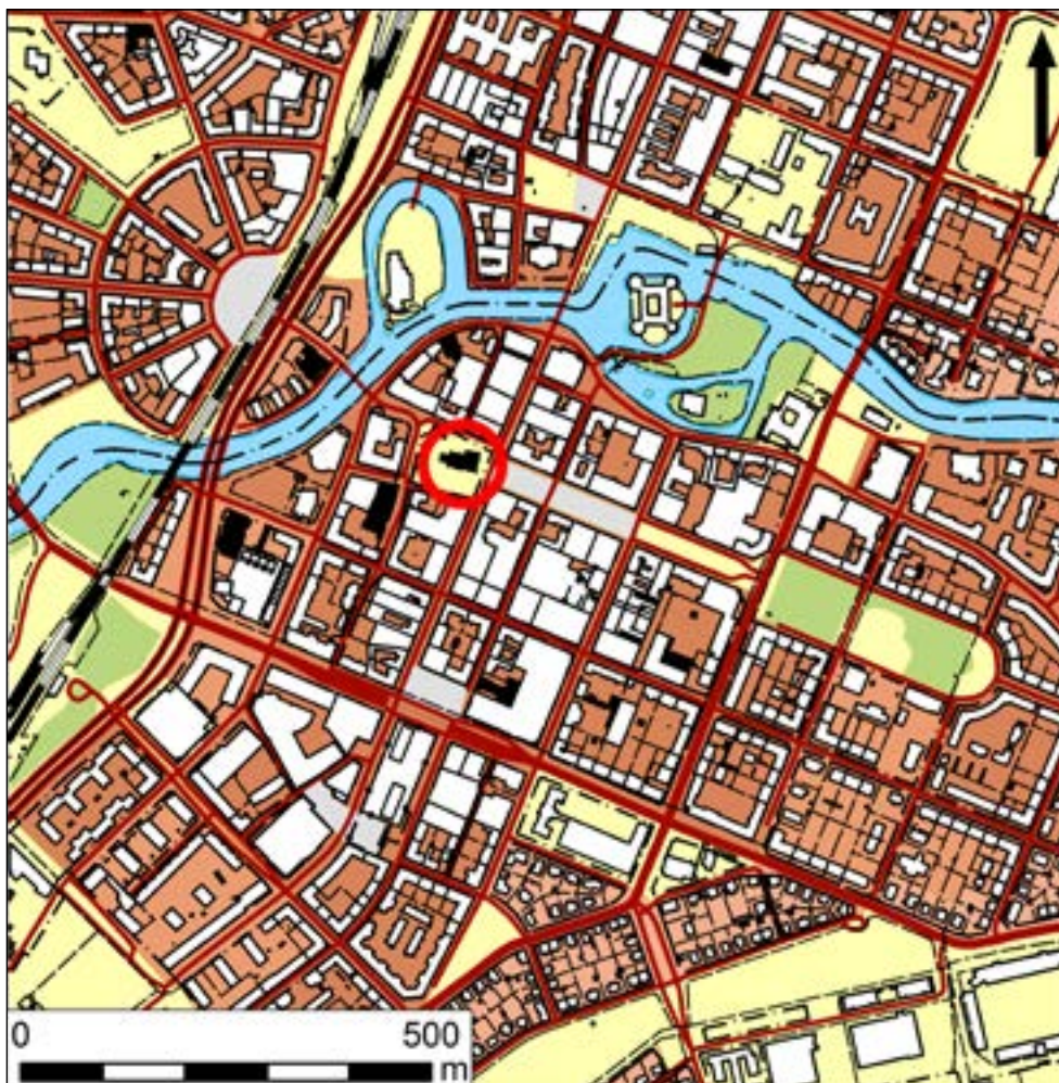
Figur 2. Utdrag ur fastighetskartan som visar S:t Nikolai kyrkas läge i Örebro. Skala 1:10 000.

Kyrkogården har använts för begravingar sedan 1200-talet fram till år 1803 då södra kyrkogården vid stadens gräns invigdes. Flytten var ett resultat av ändrade värderingar kring 1800-talets början. Att ha kyrkogårdar inne i staden ansågs ha dålig inverkan på vattenkvaliteten och som allmänt ohygieniskt. År 1815 lagfästes en förordning som innebar att kyrkogårdar skulle anläggas utanför städernas och byarnas gräns (Esbjörnson 2003).