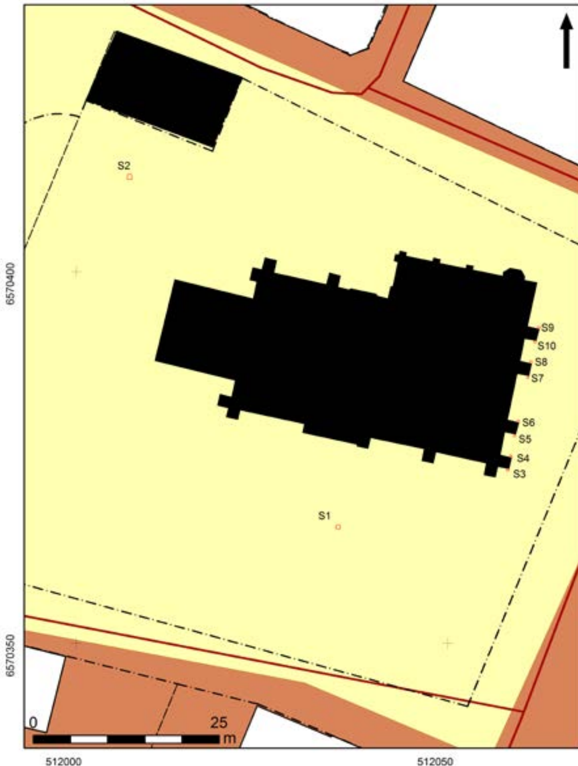
Figur 3. Schaktplan som visar de små schaktens läge. Från fundamenten i schakt 1 och 2 skulle två kraftigare strålkastare riktas mot kyrktornet. I schakt 3–10 anlades en specialjord bygel varpå en spotlightlampa gav kolonnerna ett släpljus nedifrån.