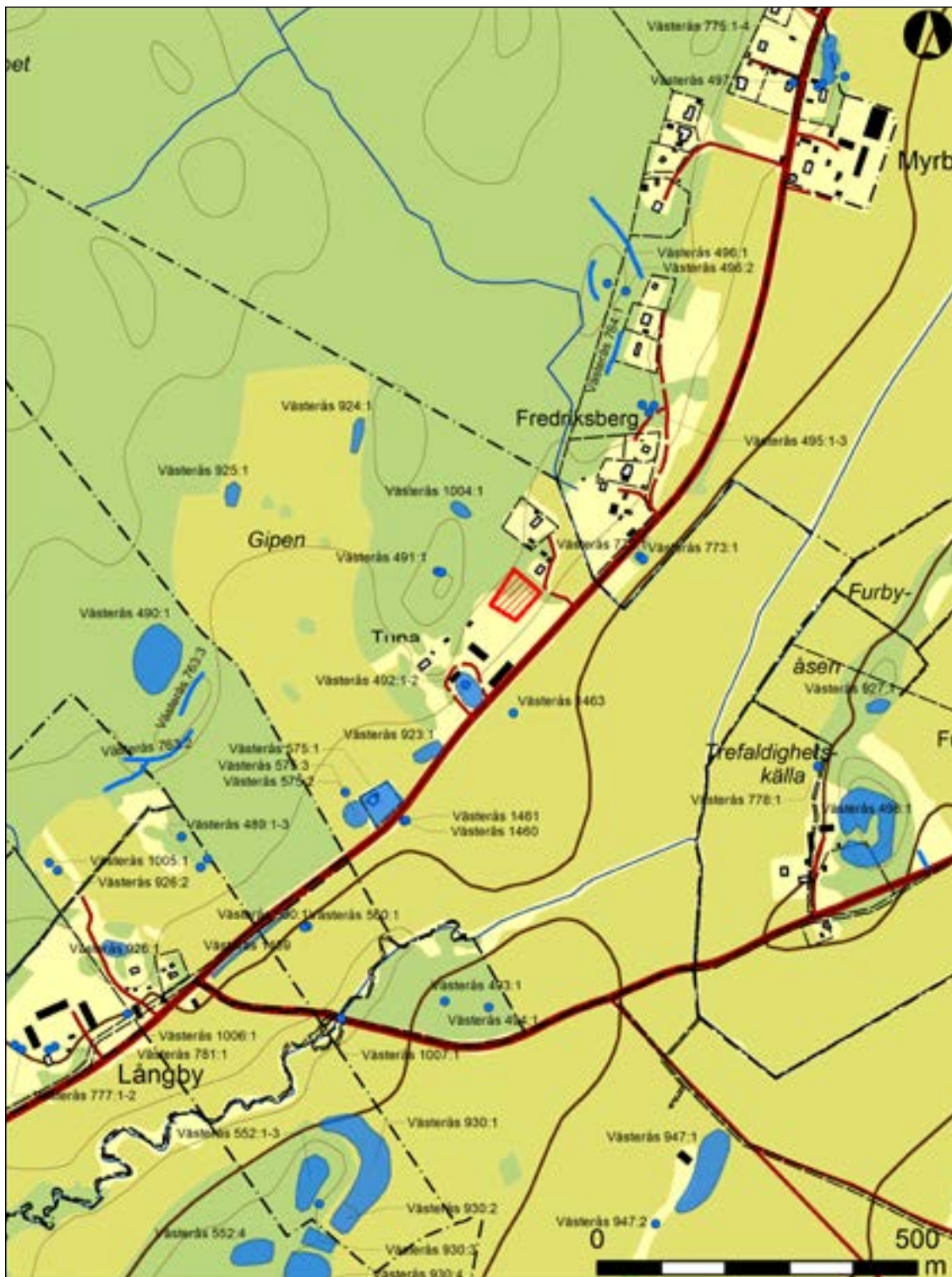
Figur 2. Karta över området kring Tuna by med fornlämningar från Forsök inlagda. Särskilt bör noteras Västerås 575:1-3, som är rester efter ett större gravfält som undersökts och borttagits. I anslutning till villan påträffades den kända kammargraven. Skala 1:10 000.