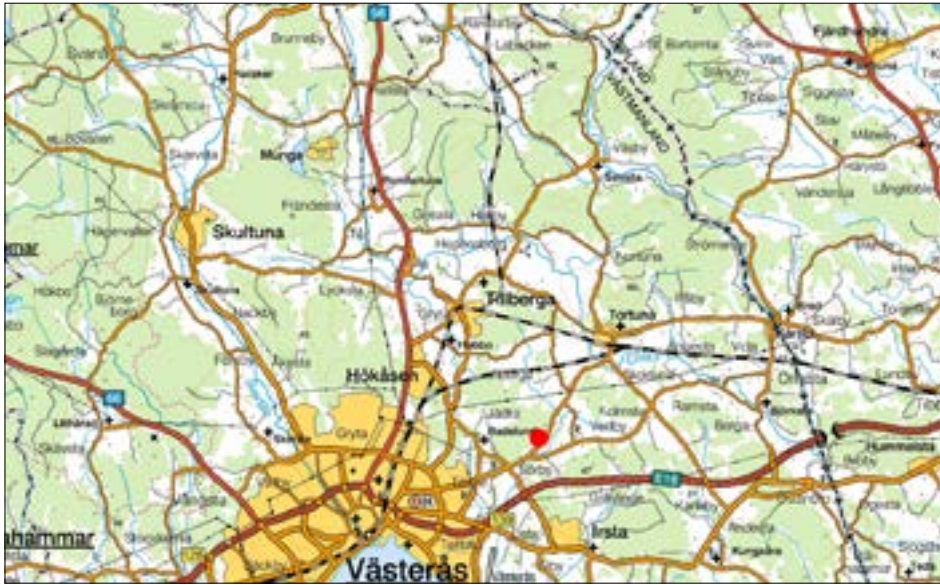
Figur 1. Karta över trakten kring Tuna i Badelunda med den aktuella undersökningsplatsen markerad med en röd prick.