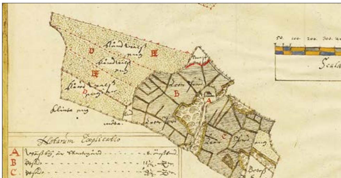
Figur 4. Utdrag ur karta från 1652 ur Lantmäteriets Historiska kartor (Akt Badelunda socken, Tuna nr 1), där den vinklade gränsen mellan inägomark och utmark markerats för det läge som utredningsområdet har idag (markerad med röd linje).

I schakten framkom inga spår av förhistorisk aktivitet. Marken har sannolikt under historisk tid använts som ängs- och/eller betesmark. Den har karaktären av översilningsäng, det vill säga att vatten från högre liggande mark periodvis har samlats här. Det har gjort området mindre lämpligt ur såväl boplatssynpunkt som plats för gravar.