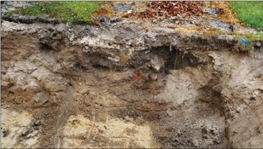
Figur 4. Schaktet med den påträffade skräpgröpen.