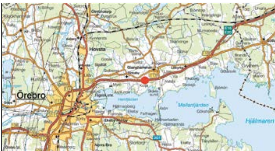
Figur 1. Karta över trakten kring Husby 7:2 med den aktuella undersökningsplatsen markerad med en röd prick.