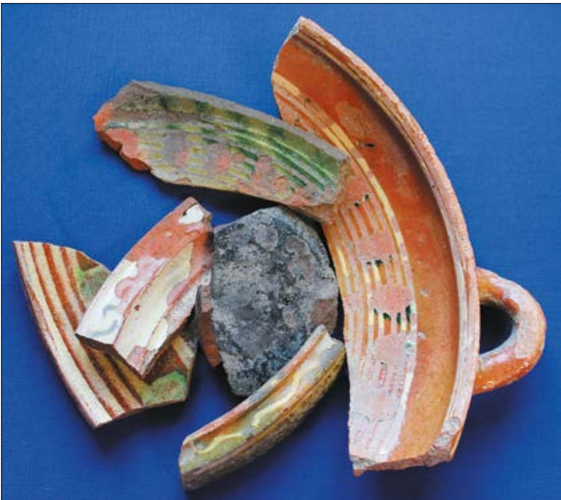
Figur 5. Fotografi på keramikskärvorna.