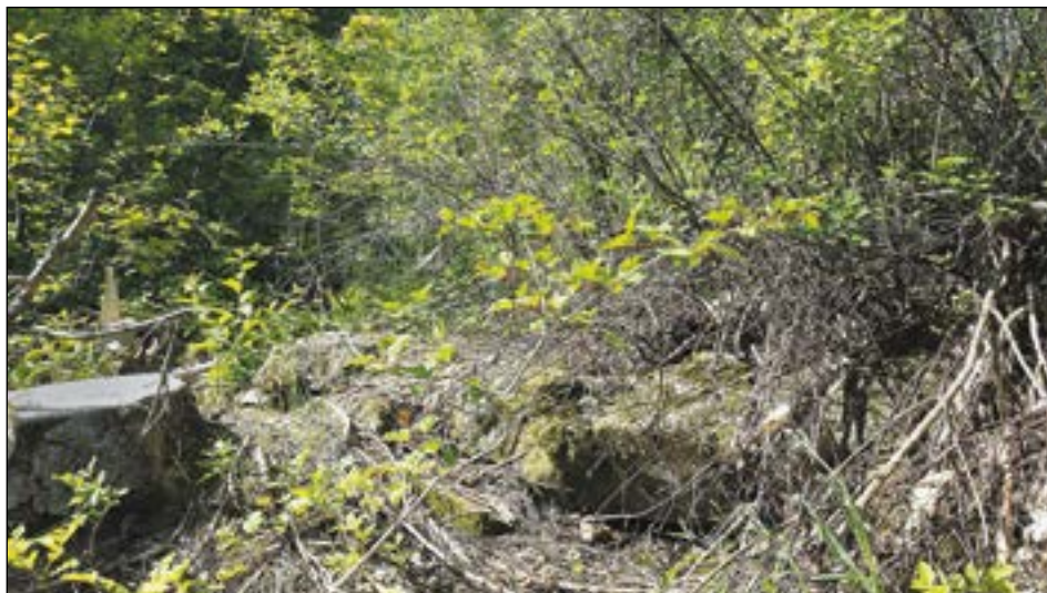
Figur 4. Delar av grundens syll bland den täta slyn som täckte delar av undersökningsområdet.

Den till gästgiveriet tillhörande ladugården finns söder om förhöjningen och dagens infart till gästgiveriet ligger mellan förhöjningen och den befintliga ladugården.