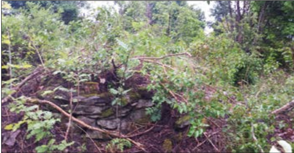
Figur 5. Spisröset.

Spisen var 2x2 meter stor och 0,2–0,7 meter hög. Utrasat kring den fanns tegelstenar som förmodligen är rester efter skortensstocken. Mängden rivningsbråte är litet, vilket gör det troligt att byggnaden har plockats ner och återanvänts som bränsle eller byggnadsmaterial.