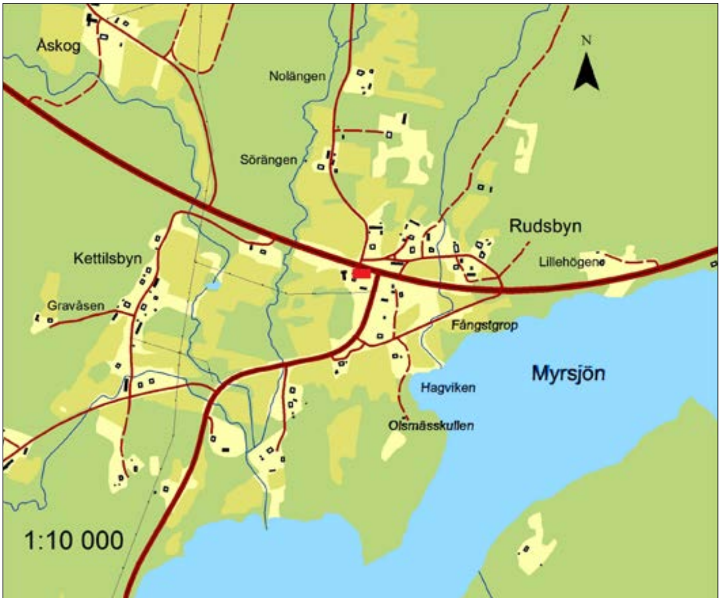
Figur 2. Översiktsplan. Skala 1:3 000.