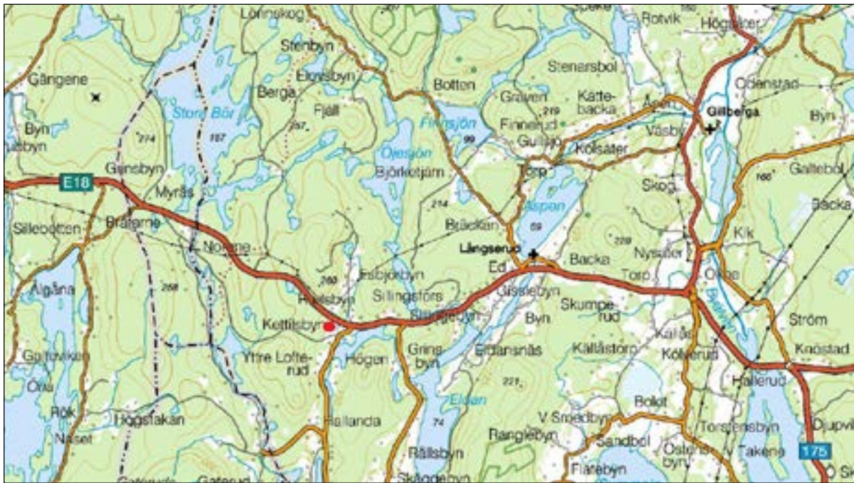
Figur 1. Översiktskarta över trakten kring gästgiveriet i Rudsbymåla med läget för den aktuella undersökningen markerad med en röd prick.