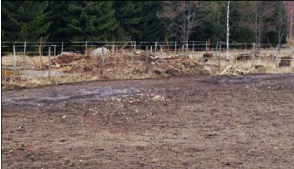
Figur 6. Den höglänkande lämningen på utredningsytan. Den har legat under golvet till den borttagna ladan. Foto från sydöst.

Härden (A201) låg ganska ytligt och täcktes av ett lager med omfattande byggnadsrester från den på platsen tidigare belägna ladan. Härden gick dock lätt att urskilja från de yngre resterna. Den bestod av en samling skärviga och skörbrända stenar i en sotig mjåla.