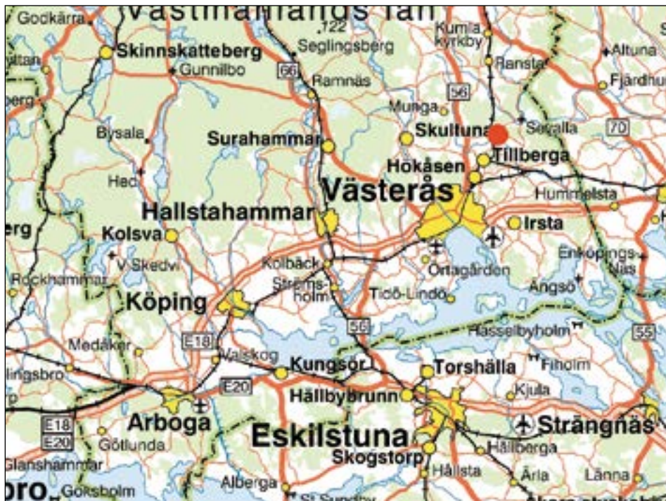
Figur 1. Karta över trakten kring Tillberga med den aktuella undersökningsplatsen markerad med en röd prick.

Gravar och spår efter bosättning i Tillberga