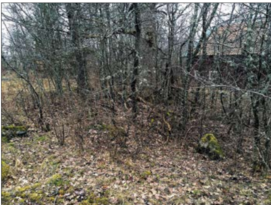
Figur 4. En av de nyupptäckta stensättningarna bakom stallet. Foto från nordväst av Leif Karlenby.

Den terrassering som Länsstyrelsen noterat förefaller vid närmare betraktande vara anlagd för en torpbyggnad eller liknande. I dag är den beväxt med ett fruktträd, sannolikt ett äppelträd (tidigt om våren är det svårt att se exakt vilken sorts träd det rör sig om). Om anläggningen är äldre eller yngre än år 1850 kunde inte avgöras. Det går inte att lokalisera någon byggnad till just denna plats på de äldre kartorna. Den ekonomiska kartan från 1962 visar ett flertal byggnader inom utredningsområdet, bland annat finns en större ekonomibygnad placerad i öst-västlig riktning norr om det befintliga stallet (se figur 5). Av ekonomibygnaden finns idag inga spår, men möjligen kan den östra gaveln ha sträckt sig upp mot terrassen. Denna skulle i så fall kunna vara resterna till en ramp upp på logen.