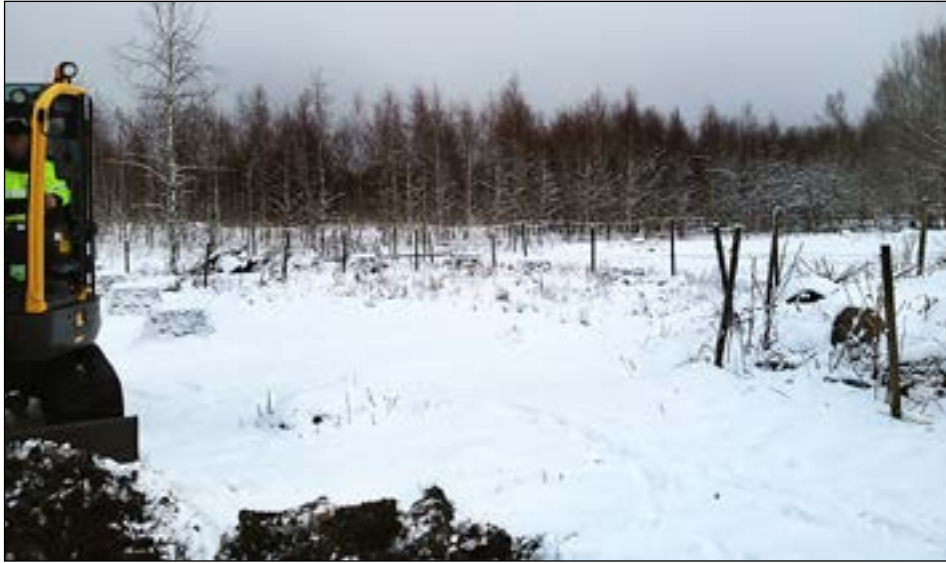
Figur 3. Vy över den västra delen av utredningsområdet. Foto från söder av Leif Karlenby.

De två lösfynden i Tillberga 105:1 har tidigare påträffats centralt inom det område som innehöll anläggningar. Det är därför högst sannolikt att de kommer från en anläggning som tillhört boplatsen och de kan ge en indikation på boplatsens ålder.