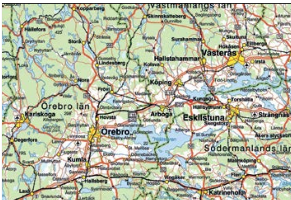
Figur 1. Karta över mellersta Sverige med den aktuella undersökningsplatsen markerad med en röd prick.