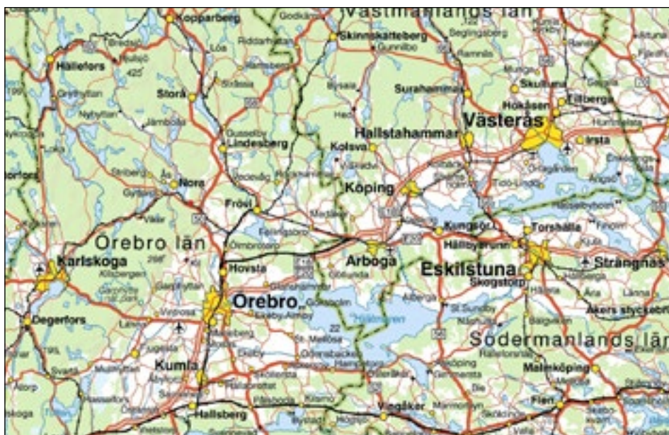
Figur 1. Karta över mellersta Sverige med den aktuella undersökningsplatsen, strax sydöst om Nora, markerad med en röd prick.