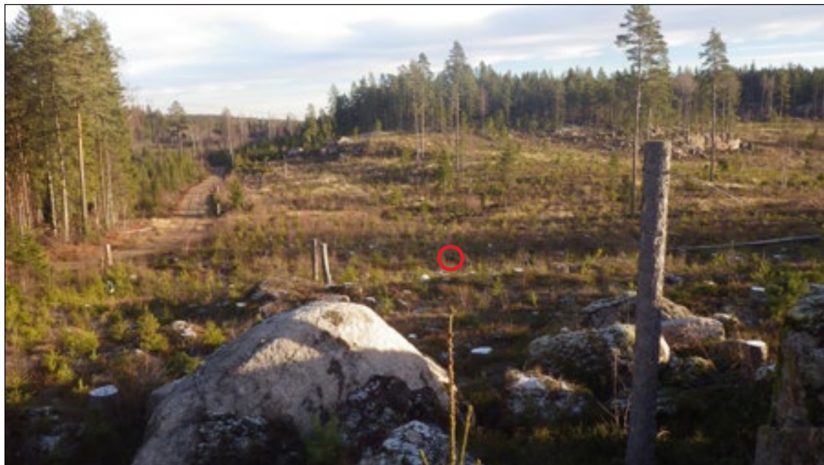
Figur 4. Foto över fyndplatsen (röd cirkel). Notera närheten till den gamla landsvägen som löpt mellan Nora och Lindersberg. Foto från väster av Johnny Rönngren.

Fyndplatsen för svärdet ligger i de södra delarna av Östra Sunds ägor. Idag består marken av skog. Kartstudier visar att fyndplatsen för svärdet legat alldeles intill en landsväg mellan Nora och Lindesberg. Söder om bergsryggarna fanns landsvägen mellan Nora och Örebro.