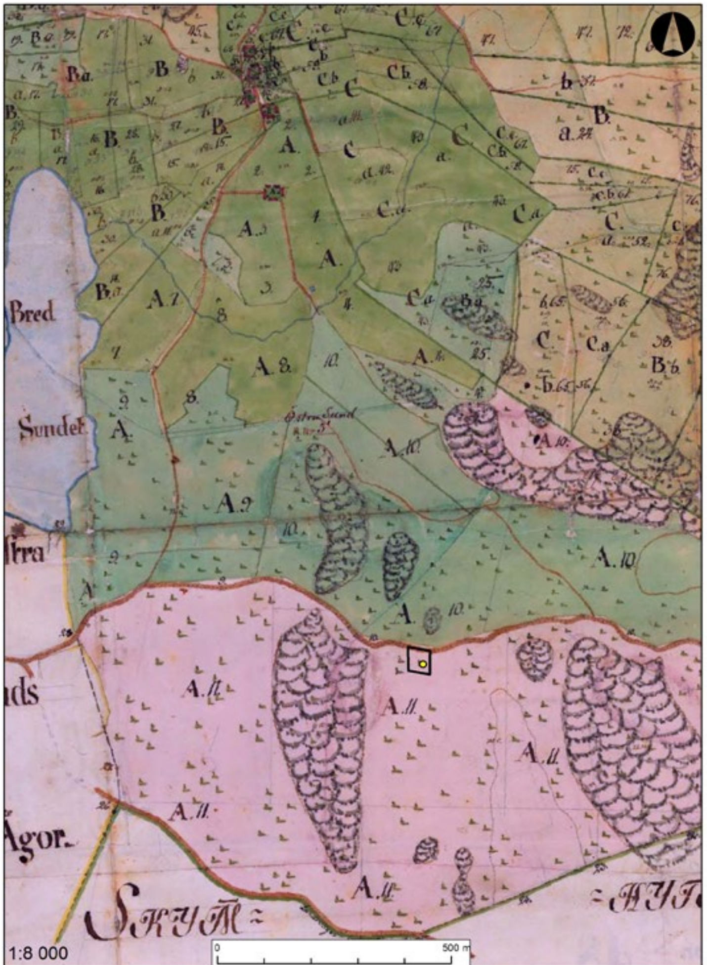
Figur 2. Karta över trakten kring Östra Sund med det aktuella undersökningsområdet markerat med en svart ram.