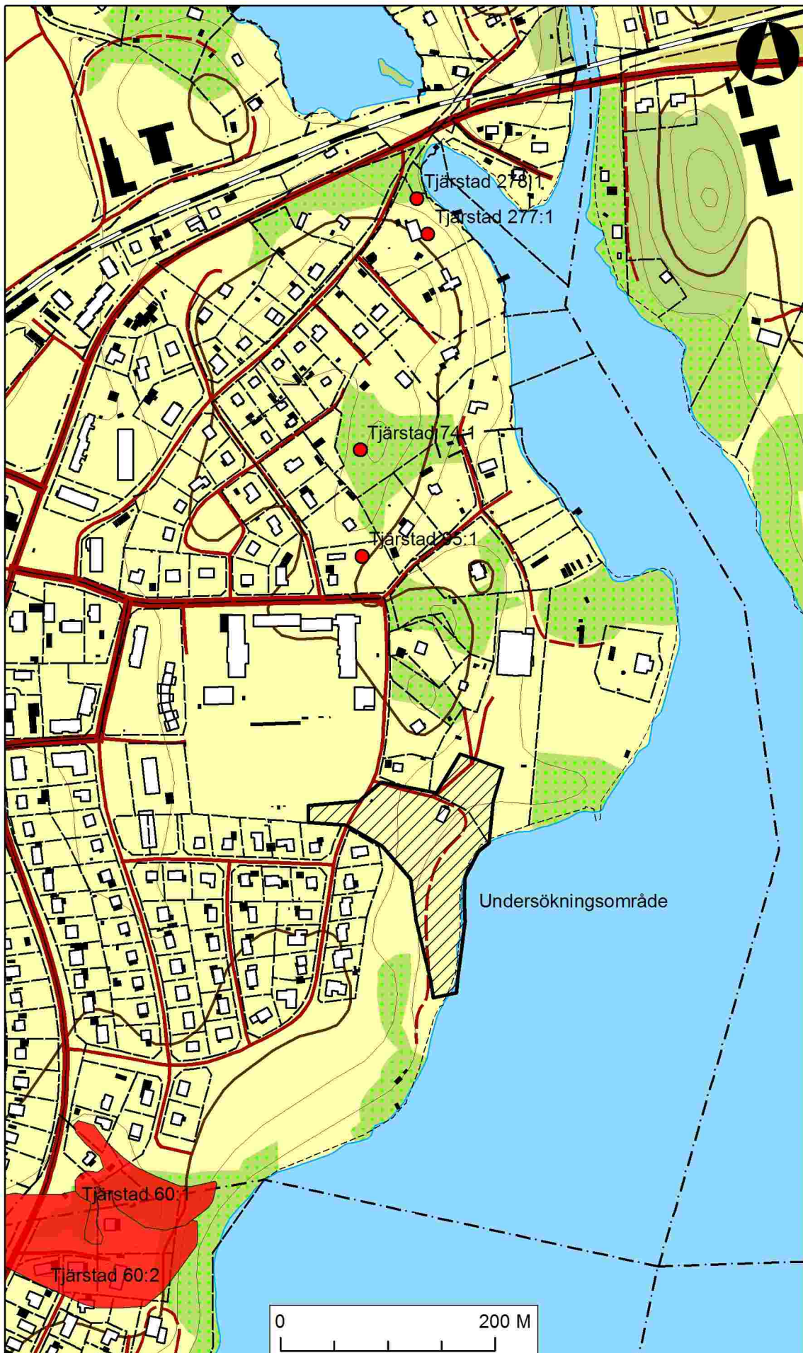
Figur 1.: Karta över trakten kring Rimforsa med den aktuella undersökningsplatsen markerad med svart skraffering. Skala 1:5000.