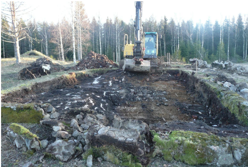
Figur 2. Foto från väster efter det att den gjutna grunden hade tömts på rivningsmassor. Till vänster syns bergklacken och till höger moränen som framkom under fyllningen.