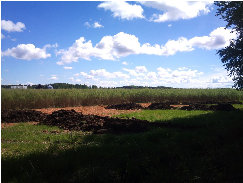
Figur 3. Översikt över den östra delen (åkerpartiet) av området.

Platsen ligger i den östra kanten av ett större skogsklätt höjdparti som vetter mot åkermarken på den vida slätten i Björksta socken. Landskapet är en typisk representant för odlingslandskapet i Mälardalen med större och mindre lerslätter uppsplittrade mellan morän- och bergspartier med skog. I åkermarken finns också åkerholmar där ofta fornlämningar förekommer i form av enstaka gravar eller gravfält. I åkermarken förekommer också fornlämningar, då ofta i form av överplöjda boplatser. Den större delen av området, som tidigare varit åker (figur 3), var före undersökningen bevuxen med energiskog och en smal remsa i den västra delen bestod av blandskog. Denna del låg i en sluttning med stark lutning och väster därom reste sig en moränrygg som var mellan 10-15 meter högre än åkermarken.