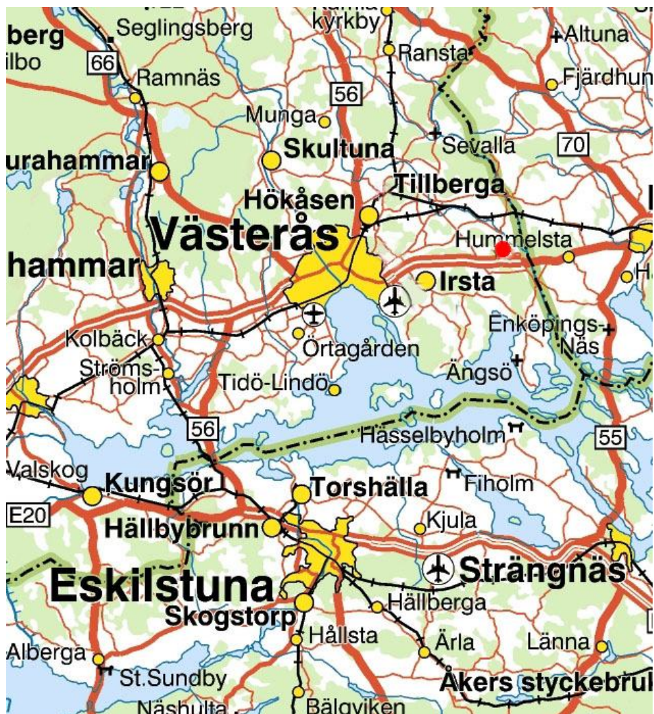
Figur 1. Karta över Västeråsområdet med den aktuella platsen markerad med en röd prick. Kartan är inte skalenlig.

Arkeologgruppen i Örebro AB genomförde en arkeologisk utredning i Åby 4:1, Björksta socken, Västmanland den 18 maj 2011 (se figur 1). En yta av 2365 m 2 planeras av markägaren att avstyckas för en villatomt. Området ligger strax öster om tidigare registrerade fornlämningar Björksta 360:1-3 samt Björksta 516:1. I de schakt som grävdes fanns inga fornlämningar. Strax väster om exploateringsytan fanns resterna efter en så kallad röckur, där man kallrökt fläsk fram på 1960-talet.