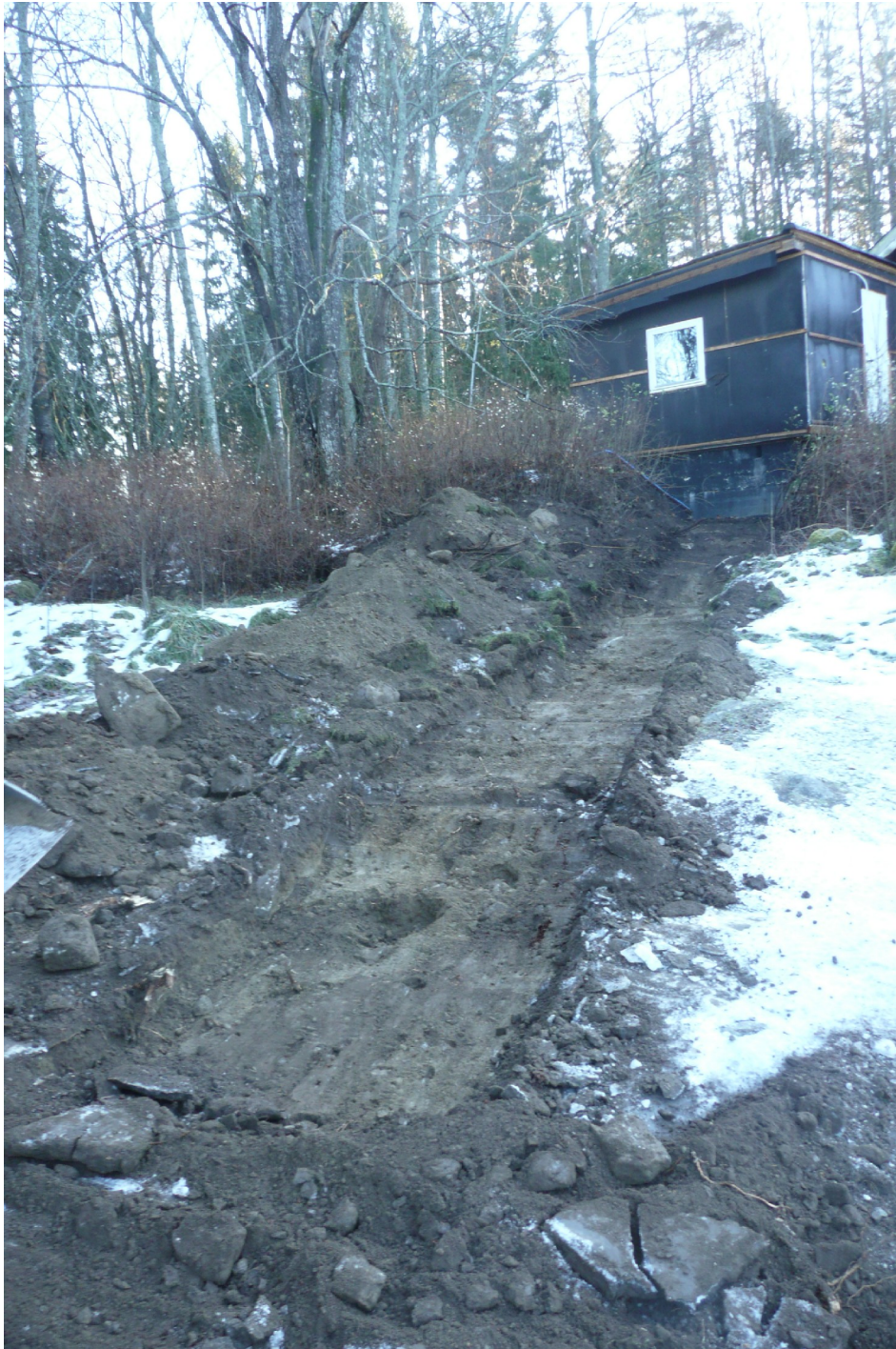
Figur 3. Schaktet sett från norr. Invid den högra schaktkanten, ett par meter från änden, kan man ana stensamlingen som påträffades vid schaktningsarbetena.