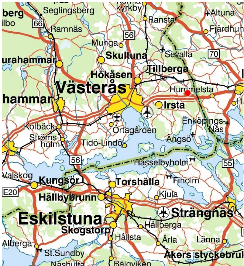
Figur 1. Karta över Västeråsområdet med den aktuella platsen markerad med en röd prick. Kartan är inte skalendig.

Arkeologgruppen i Örebro AB genomförde en arkeologisk antikvarisk kontroll i Ytterberga 1:4 och 2:1, Björksta socken, Västmanland den 16 november 2010. I det schakt som grävdes inför en avloppsanläggning påträffades en samling med sten. Denna bedömdes dock inte vara en fornlämning. Kontrollen föranleddes av att söder om platsen för schaktet fanns registrerat en storstensättning (Björksta 113:1) och ett mindre hägnadssystem (Björksta 113:2).