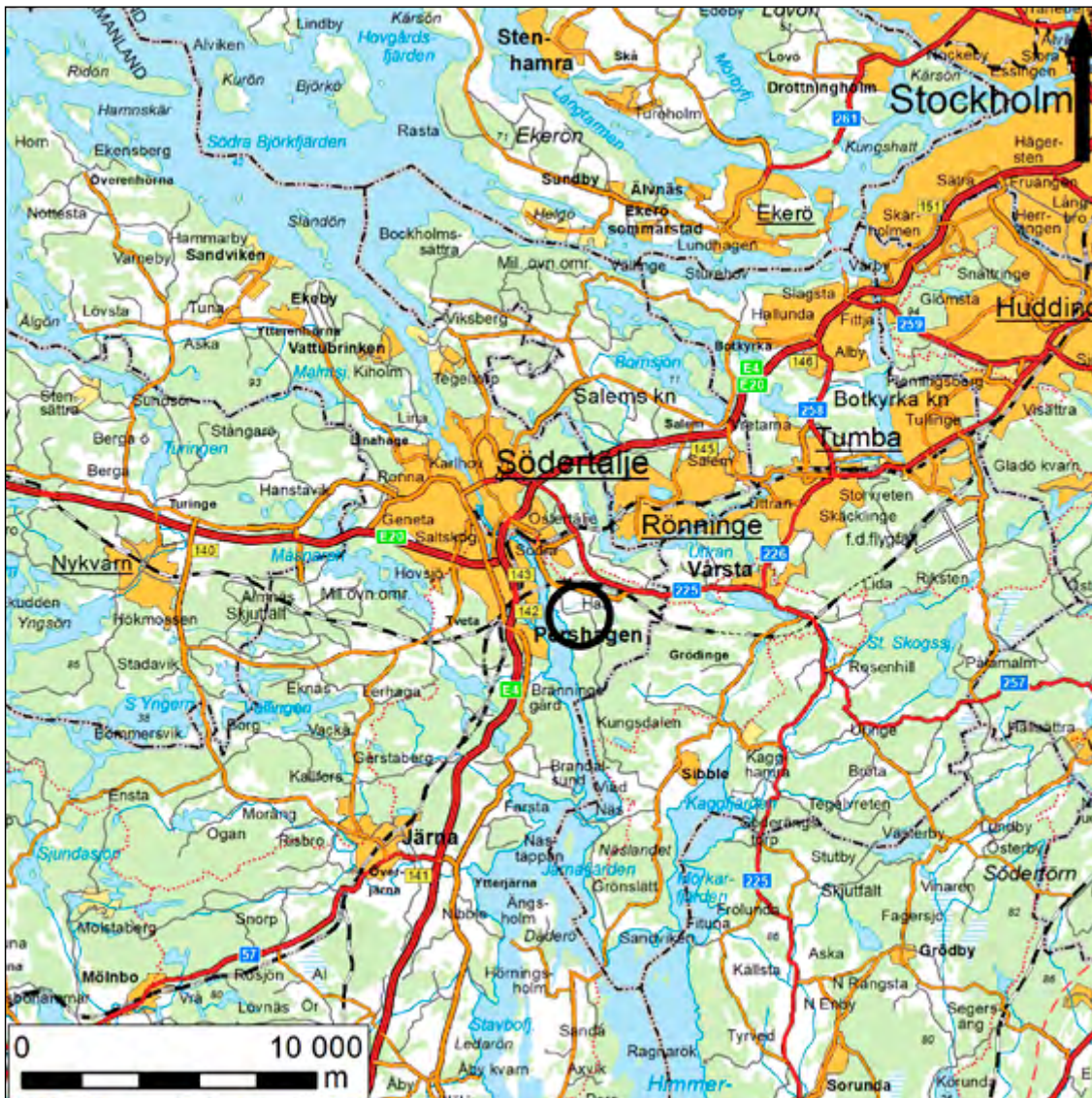
Figur 1. Karta över Östertälje med den aktuella undersökningsplatsen markerad med svart. Skala 1:250 000.