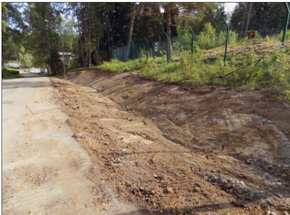
Figur 2. Foto av schakt 2. Sett från söder.