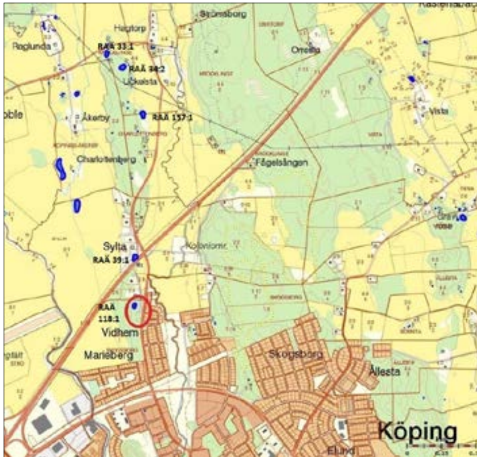
Figur 1. Översikt över utredningsområdet Skogsborg, markerat med en röd ring, i förhållande till Köping. På kartan syns de i texten omtalade gravfälten Köping 118:1, 39:1, 157:1, 34:2 samt 33:1.