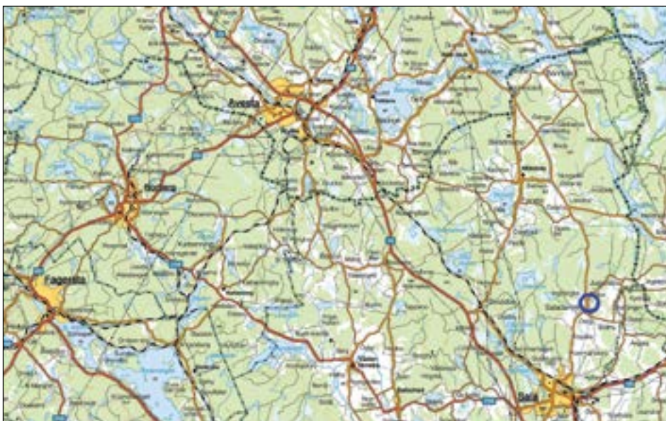
Figur 1. Karta över trakten kring Södra Ingborgbo med den aktuella undersökningsplatsen markerad med en blå cirkel.