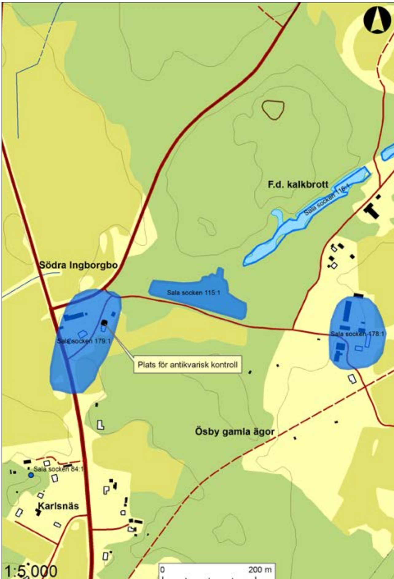
Figur 2. Karta över Södra Ingborgbo som visar platsen för den antikvariska kontrollen. Skala 1:5 000.