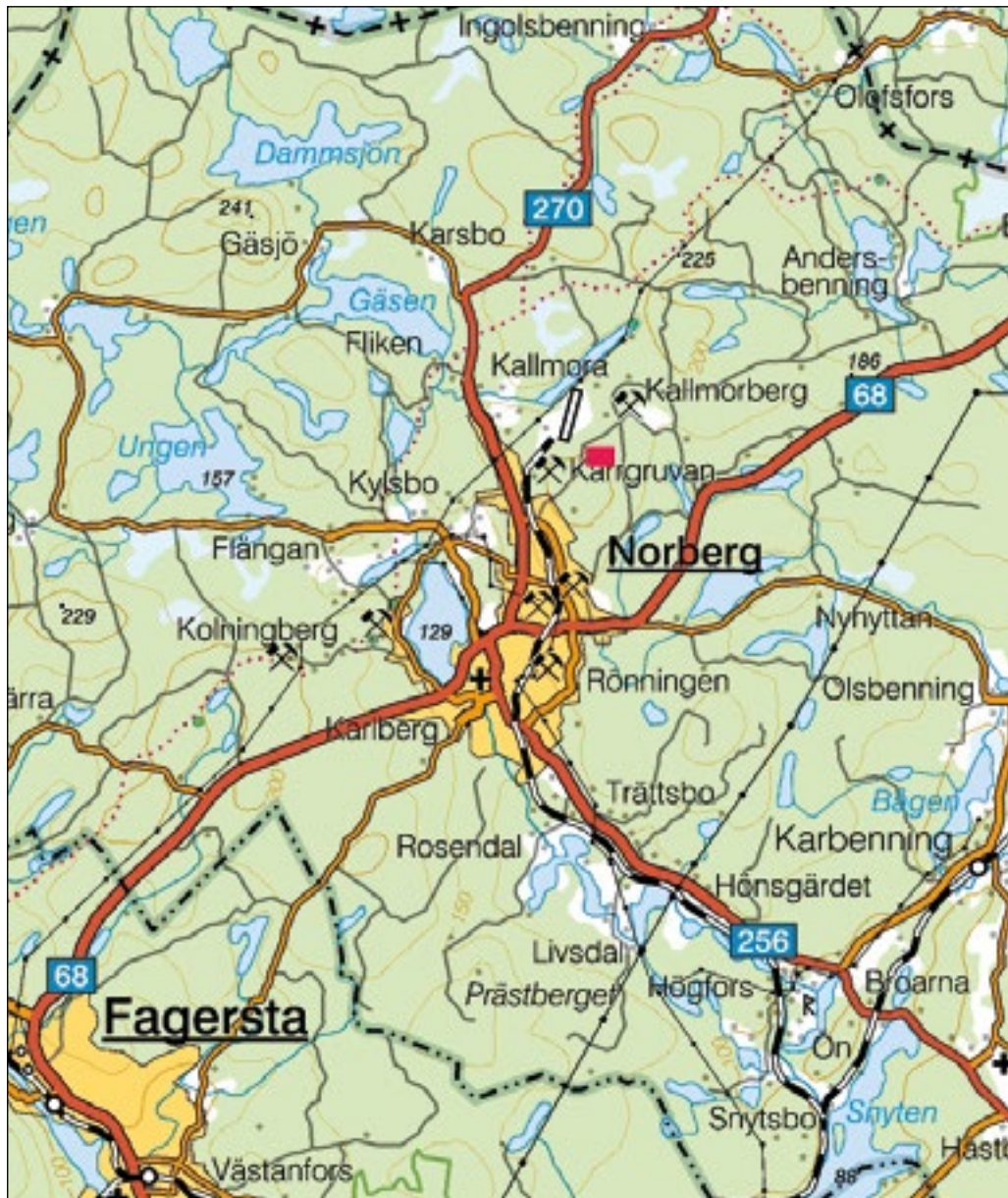
Figur 1. Karta över trakten kring Norberg och Kallmora. Utredningsområdet är markerat med en röd fyrkant.