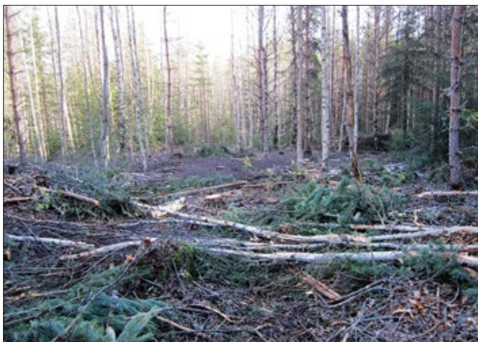
Figur 4. En del av den nyligen slyröjda inventeringsytan.

Det historiska kartmaterialet som hörrör från slutet av 1600-talet och fram till idag visar att undersökningsområdet genom århundradena har varit beläget i skogsmark med berg i dagen. Det finns i kartmaterialet inga synliga aktiviteter i området. Historiska museets fynddatabas har heller inga arkeologiska lösfynd från området.