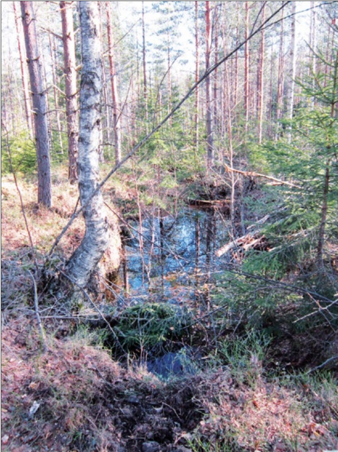
Figur 2. Ett av de mindre gruvhålen ingående i RAÄ 235:1 som ligger direkt norr om det aktuella utredningsområdet.